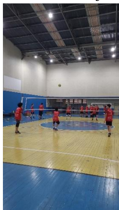
Rendimento SER SADIA