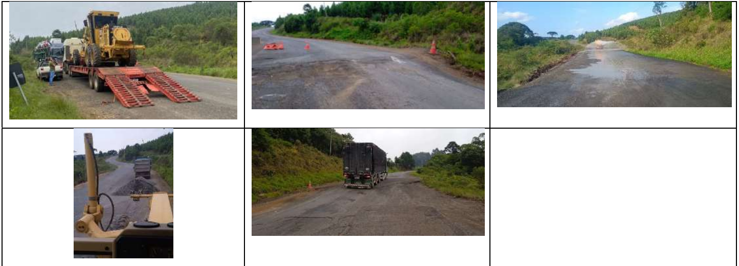
Manutenção Base 30/11/2023