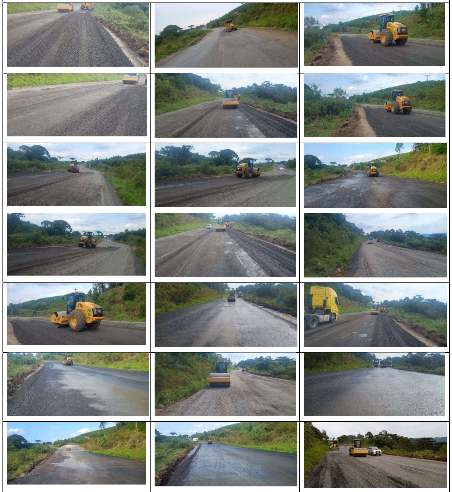
Execução Base 10/11/2023