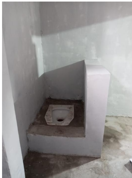
Fotos 06 ,07, 08 e 09 – Cella feminina e masculina, entrada e interior.

Avenida Governador Ivo Silveira, 1.521 - CEP 88.085-000 Centro Administrativo da SSP - Bloco - 2º andar - Capoeiras – Florianópolis/SC Fone: (48) 3665.8712 E-mail: geted@pc.sc.gov.br