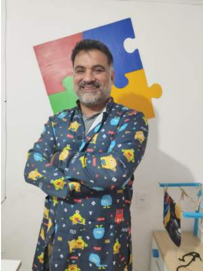
CONTRATAÇÃO DO TERAPEUTA OCUPACIONAL

CNPJ:34.129.425/0001-17 - Sede: Rua José Claudio Vieira, nº 36, casa 2 Centro – Penha/SC - fone:47-99125.9658