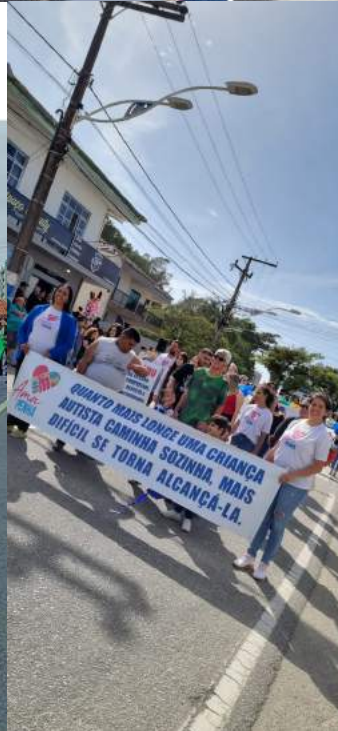
DESFILE 07 DE SETEMBRO – AMA -PENHA

“Quanto mais longe uma criança com autismo caminha sem ajuda, mais difícil se torna alcançá-la”