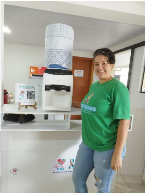
GANHAMOS UM BEBEDOURO DE AGUA FRIA