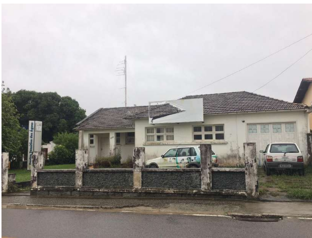
Figura 01: Fachada do imóvel