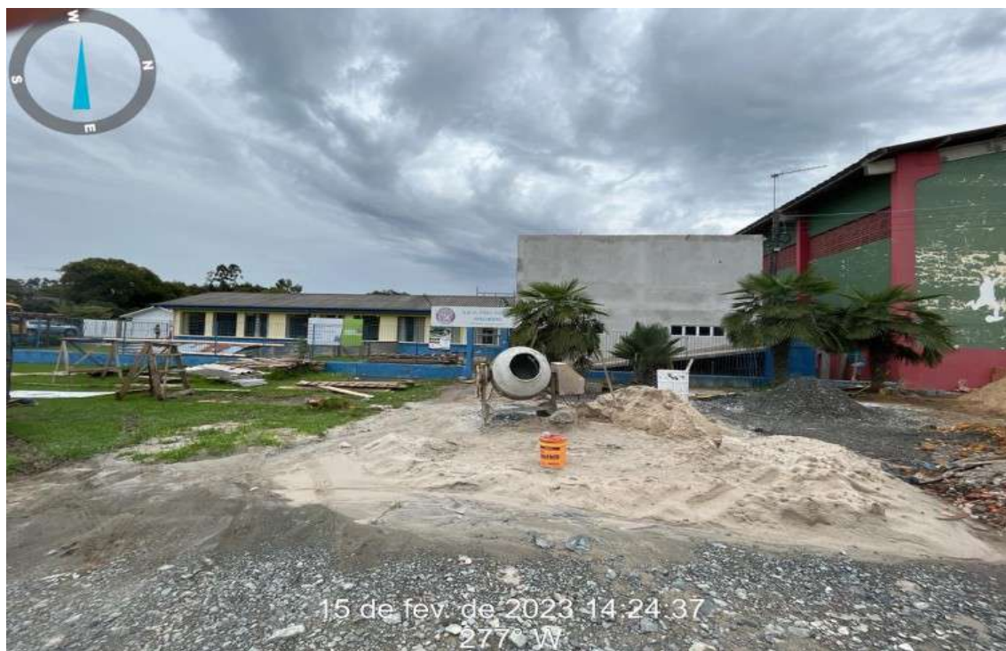
Figura 01: Fachada do imóvel

Descrição do imóvel: E.E.F. FREI ANDRE MALINSKI