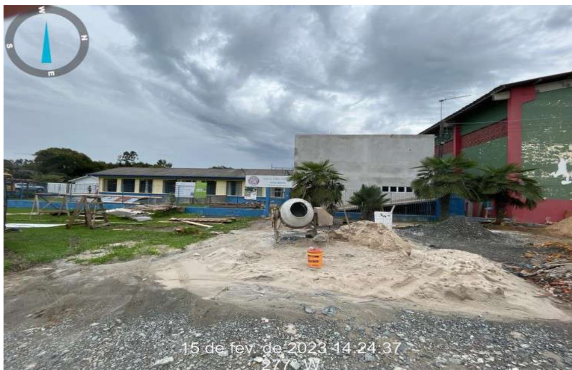
Figura 01: Fachada do imóvel

Descrição do imóvel: E.E.F. FREI ANDRE MALINSKI