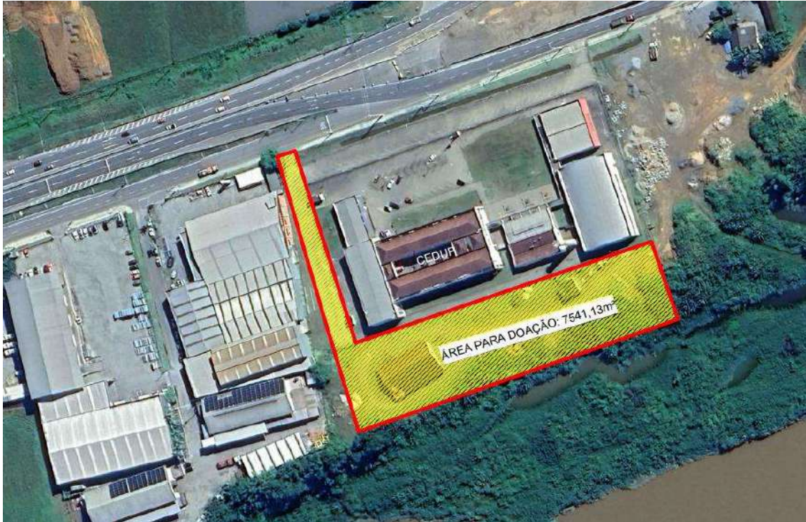
Croqui de identificação da área objeto da descrição