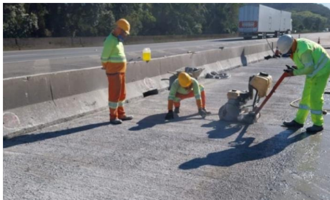
Figura 03 – Recuperação do pavimento – Balança Garuva/SC