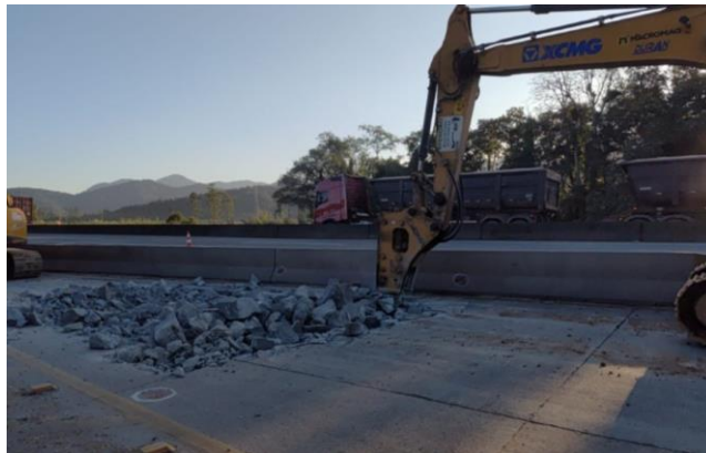
Figura 02 – Recuperação do pavimento – Balança Garuva/SC