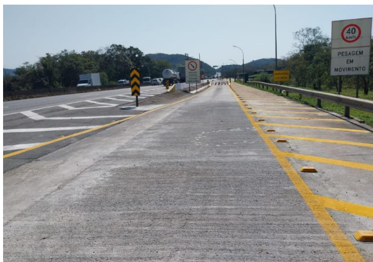
Figura 04 – Recuperação do pavimento – Balança Garuva/SC