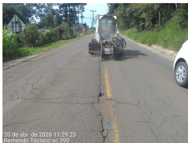
20 de abr. de 2026 11:29:23 Remendo Técnico sc 390