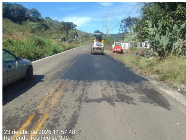
FT 04 – Manutenção da SC 390 – ABR/2026