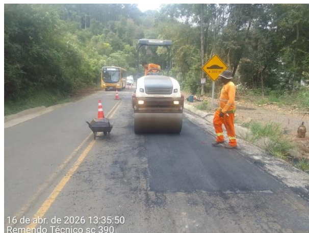
FT 06 – Manutenção da SC 390 – ABR/2026