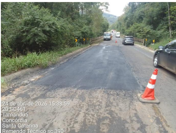
FT 05 – Manutenção da SC 390 – ABR/2026