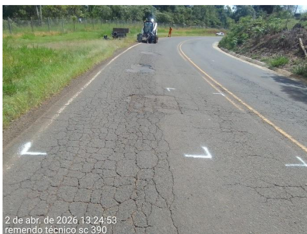
2 de abr. de 2026 13:24:53 remendo técnico sc 390

Estão programadas para o mês de junho/26 a implantação de sinalização horizontal e o reforço na sinalização vertical no referido trecho, complementando assim os serviços de manutenção e conservação ora aplicados na rodovia estadual SC 390.