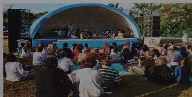
PRAÇA dos Direitos Humanos recebe evento neste sábado