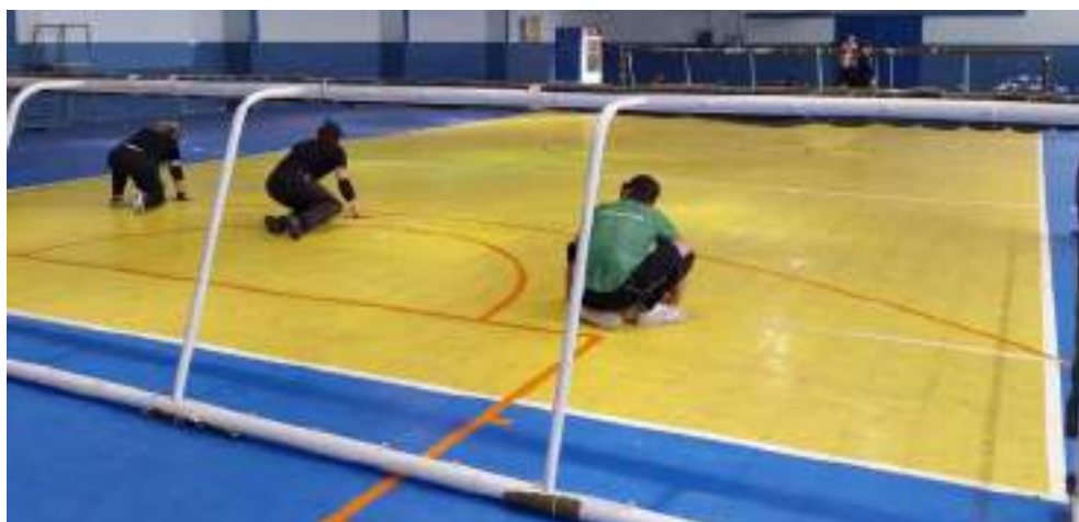
Retorno aos treinamentos de Goalball naipes masculino e feminino