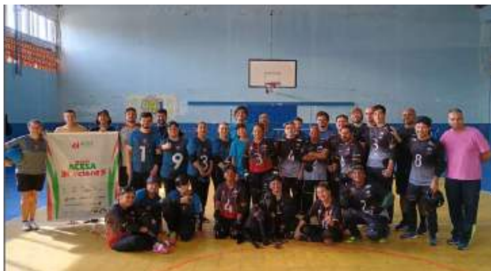
Amistosos com equipe da AJIDEV - JOINVILLE