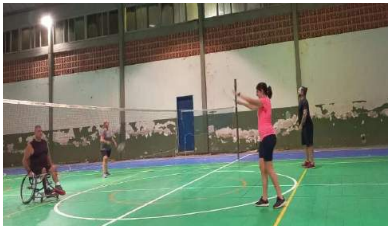
Retorno aos treinos de parabadminton.