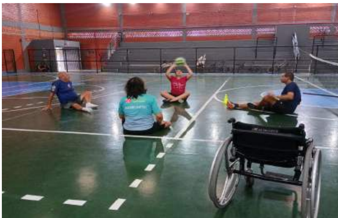
Retorno aos treinos de voleibol sentado.