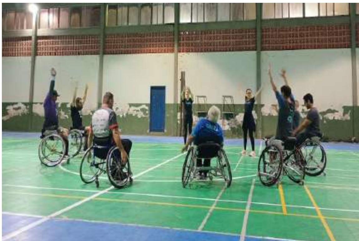
Retorno aos treinos de handebol em cadeira de rodas.