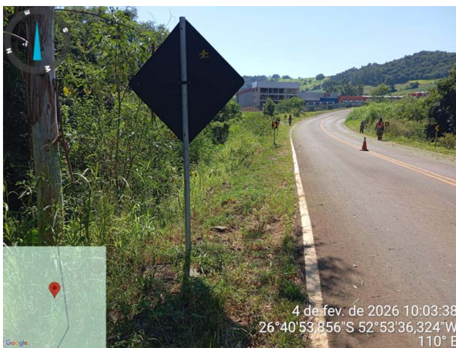
Foto 2 – Conservação e manutenção rodoviária SC 159 – Fevereiro/2026.