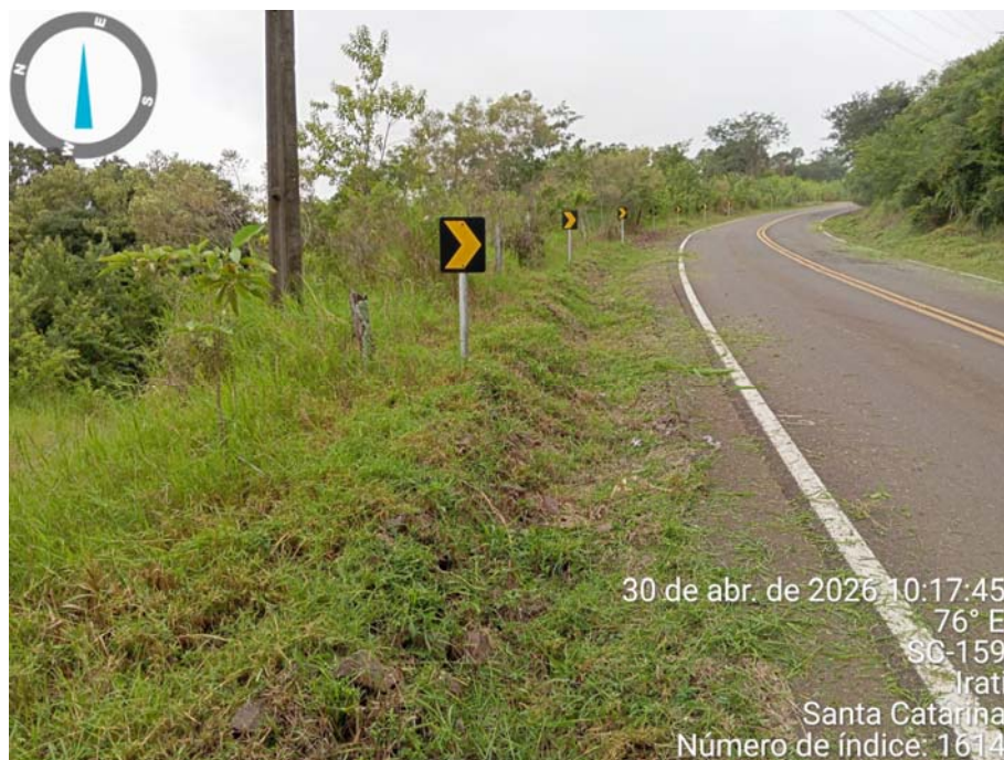
Foto 5 – Conservação e manutenção rodoviária SC 159 – Abril/2026.