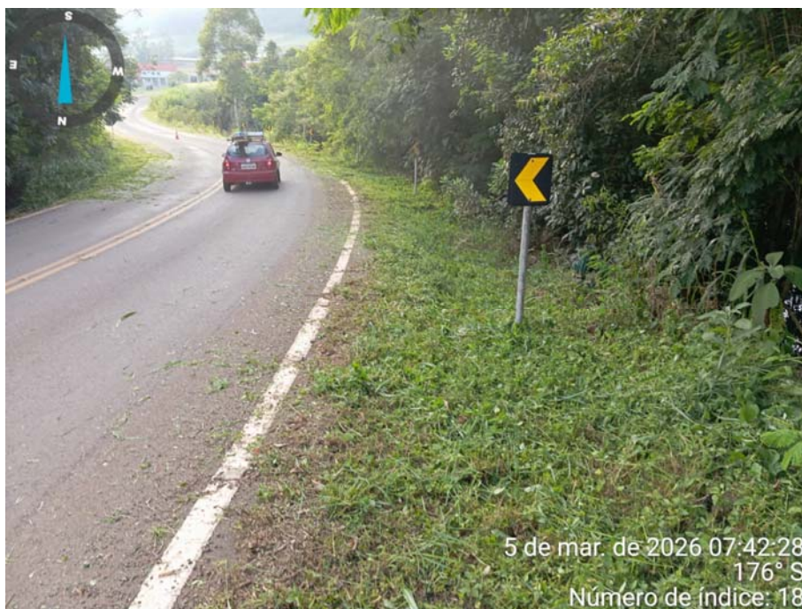
Foto 3 – Conservação e manutenção rodoviária SC 159 – Março/2026.