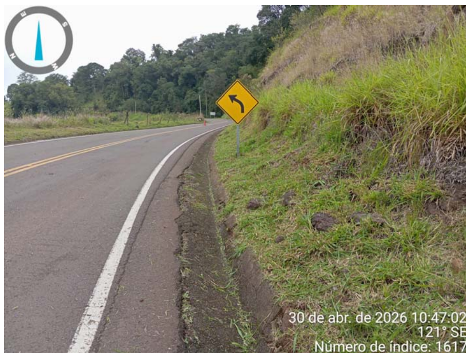
Foto 6 – Conservação e manutenção rodoviária SC 159 – Abril/2026.