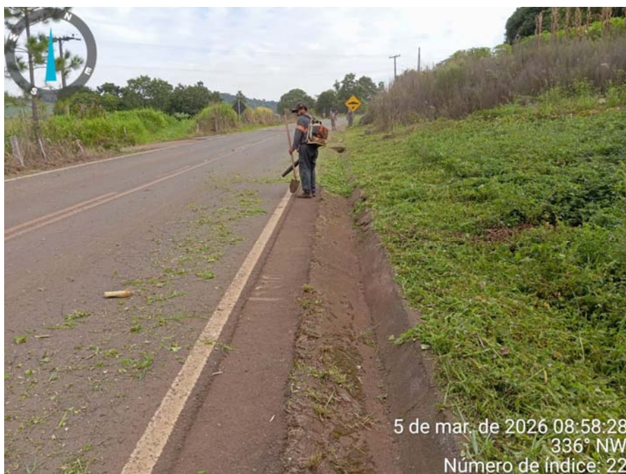
Foto 4 – Conservação e manutenção rodoviária SC 159 – Março/2026.