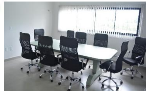
APAE de Schroeder/SC