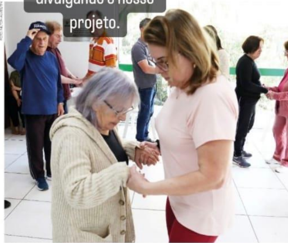
O grupo ProPark foi criado em 2017 e conta com mais de 60 integrantes da região