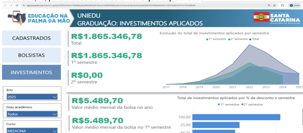
Recorte 1: Consulta App Power BI, Educação na Palma da Mão, UNIEDU, acesso em 14/07/2025.

Catarina”, é possível visualizar, inclusive, de acordo com o recorte 1, o valor médio mensal da bolsa no ano, em sendo, R$ 5.489,70 bem como o investimento aplicado de R$ 1.865.346,78, para o caso do curso e instituição supracitados.