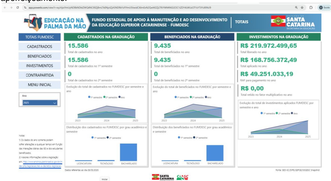
Recorte 4: Consulta App Power BI, Educação na Palma da Mão, painel FUMDESC, acesso em 14/07/2025.

Em relação ao FUMDESC, a consultoria segue o mesmo passo a passo, também sendo possível consultar os dados de acordo com os filtros desejados, tais como, estudantes cadastrados, beneficiados, investimentos, e contrapartida, esta última, em fase de aperfeiçoamento.