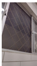
tela janela.jpg 96K