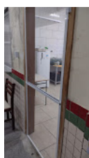
tela porta.jpg 127K