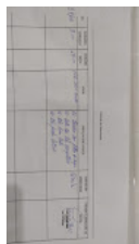
assinatura serviços.jpg 79K