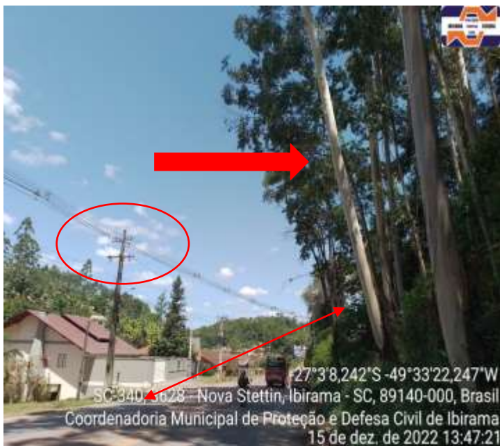
Foto 2: Destaca-se a tendência de inclinação da árvore em relação à rodovia estadual.

Foto 1: Destaca-se a inclinação anormal da árvore de espécie Eucalipto e sua proximidade com a rodovia estadual SC-340, bem como da rede de abastecimento de energia elétrica da CELESC.