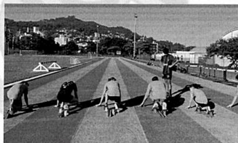
Foto: Treino na UFSC.

Colocamo-nos à disposição para mais informações.