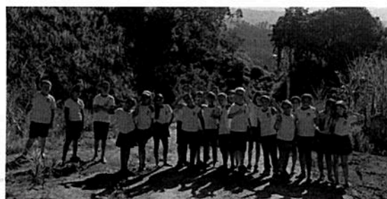
Foto: Alunos do contraturno do bairro Santa Maria