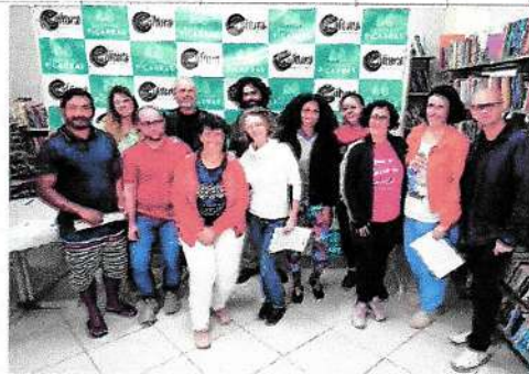
R$ 20.000,00 da Lei Paulo Gustavo para produção de um Documentário