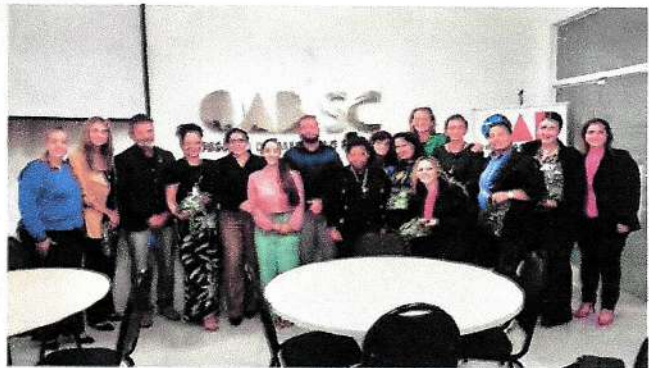
Quinze cordões de girassol OAB Piçarras