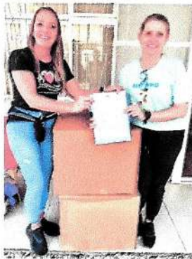
Três Computadores Feamas