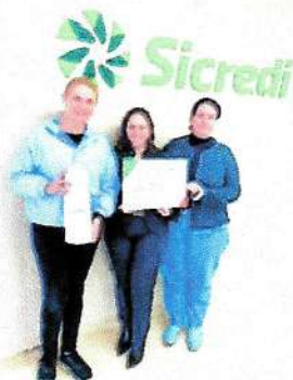
R$ 4.380,00 Itens Oficinas Sicredi