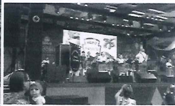
Fanfarra da Escola General Lúcio Esteves animando o pavilhão.