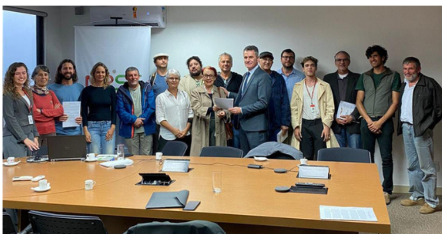
REUNIÃO NA 22ª PROMOTORIA DO MINISTÉRIO PÚBLICO DE SANTA CATARINA JUNTO A DIVERSOS MOVIMENTOS AMBIENTALISTAS