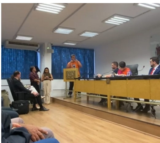
AUDIÊNCIA PÚBLICA DE CRIAÇÃO DA COMISSÃO ESPECIAL DAS UNIDADES DE CONSERVAÇÃO NA CÂMARA DE VEREADORES

Participamos de diversas reuniões e audiências em defesa da publicação dos Planos de Manejo das UCs municipais