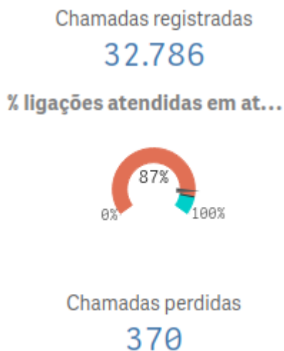
Figura 2 - Estatística de chamadas do COBOM 9ºBBM - ano de 2024