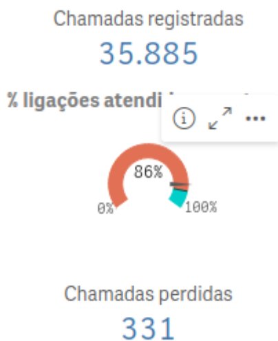
Figura 1 - Estatística de chamadas do COBOM 9ºBBM - ano de 2023

A porcentagem apresentada nos gráficos do Business Intelligence (BI), presentes nas figuras 1, 2 e 3, se referem à “% de ligações atendidas em até 10 segundos”.