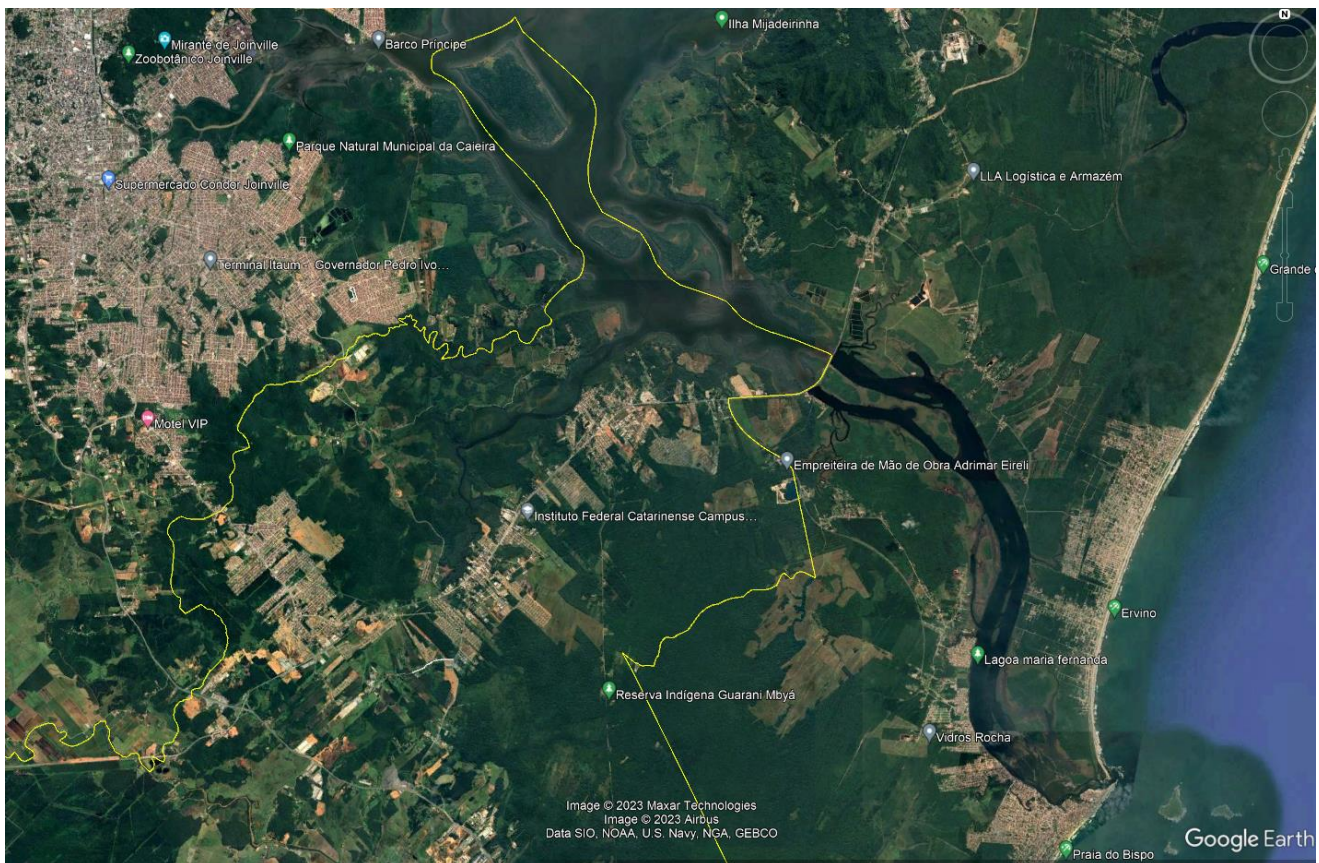
Figura 01 – Divisas territoriais do Município de Araquari consolidadas conforme Projeto de Lei Estadual ora proposto em epígrafe.