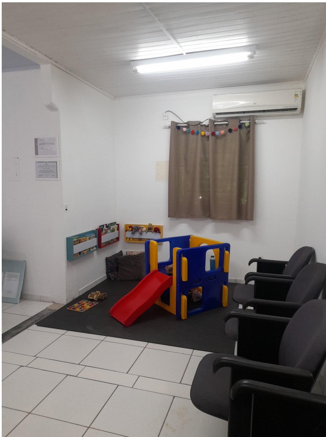
(Sala de recepção)

ASSOCIAÇÃO FORQUILHINHENSE DE APOIO AOS AUTISTAS – AFAA – 47.955.967/0001-90.