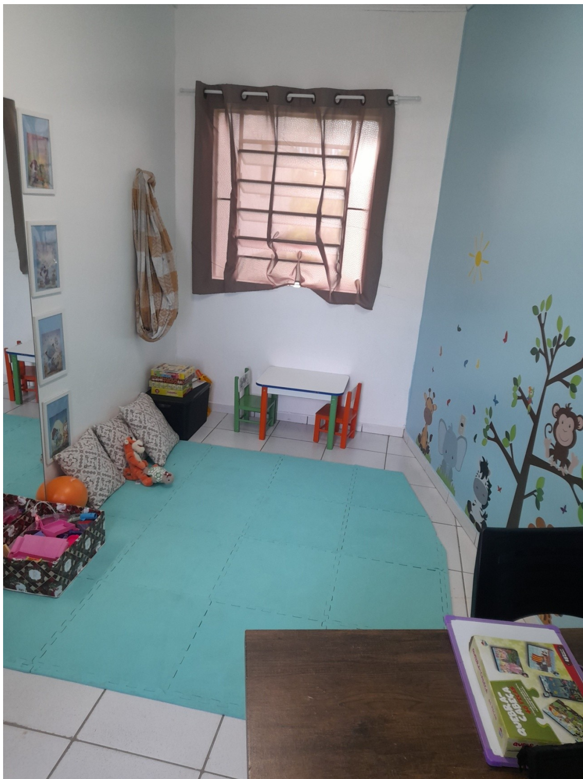
(Sala da Fonoaudióloga)

ASSOCIAÇÃO FORQUILHINHENSE DE APOIO AOS AUTISTAS – AFAA – 47.955.967/0001-90.