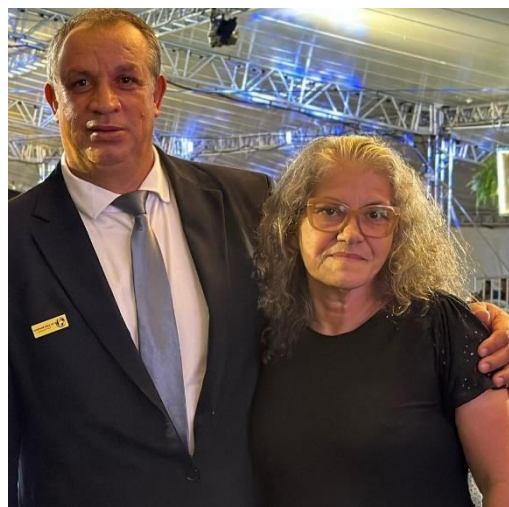
VICE-PRESIDENTE E ESPOSA