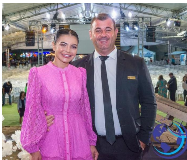
PRESIDENTE E ESPOSA