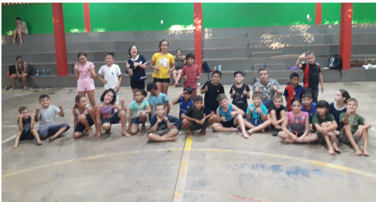
ESCOLA ATTILIO LUIZ CALZA, BAIRRO SANTA RITA