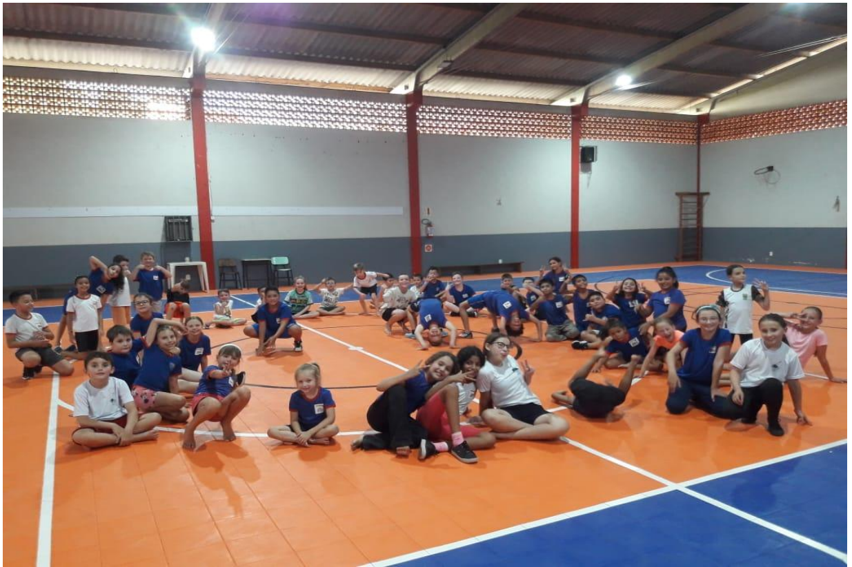
ESCOLA EMMA BALKE, BAIRRO CENTRO