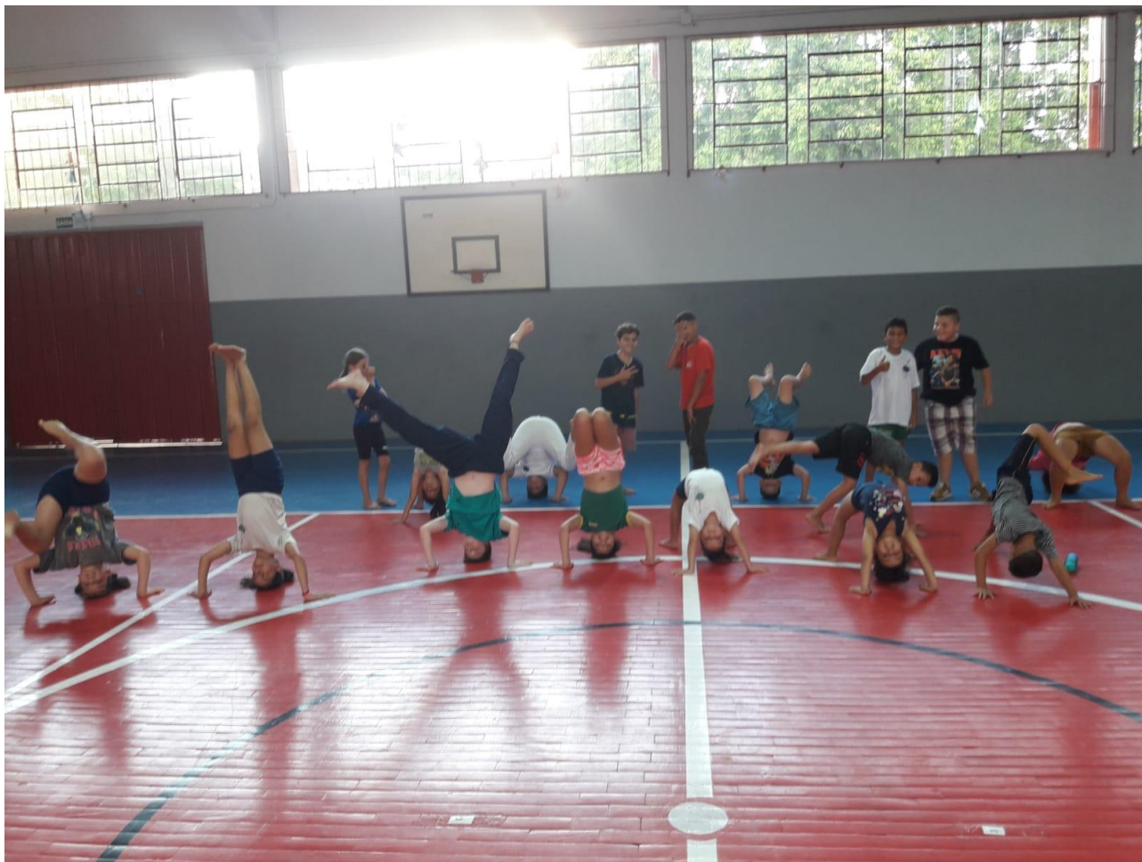
ESCOLA TRANQUILO RIGONI, BAIRRO ANDREATTA