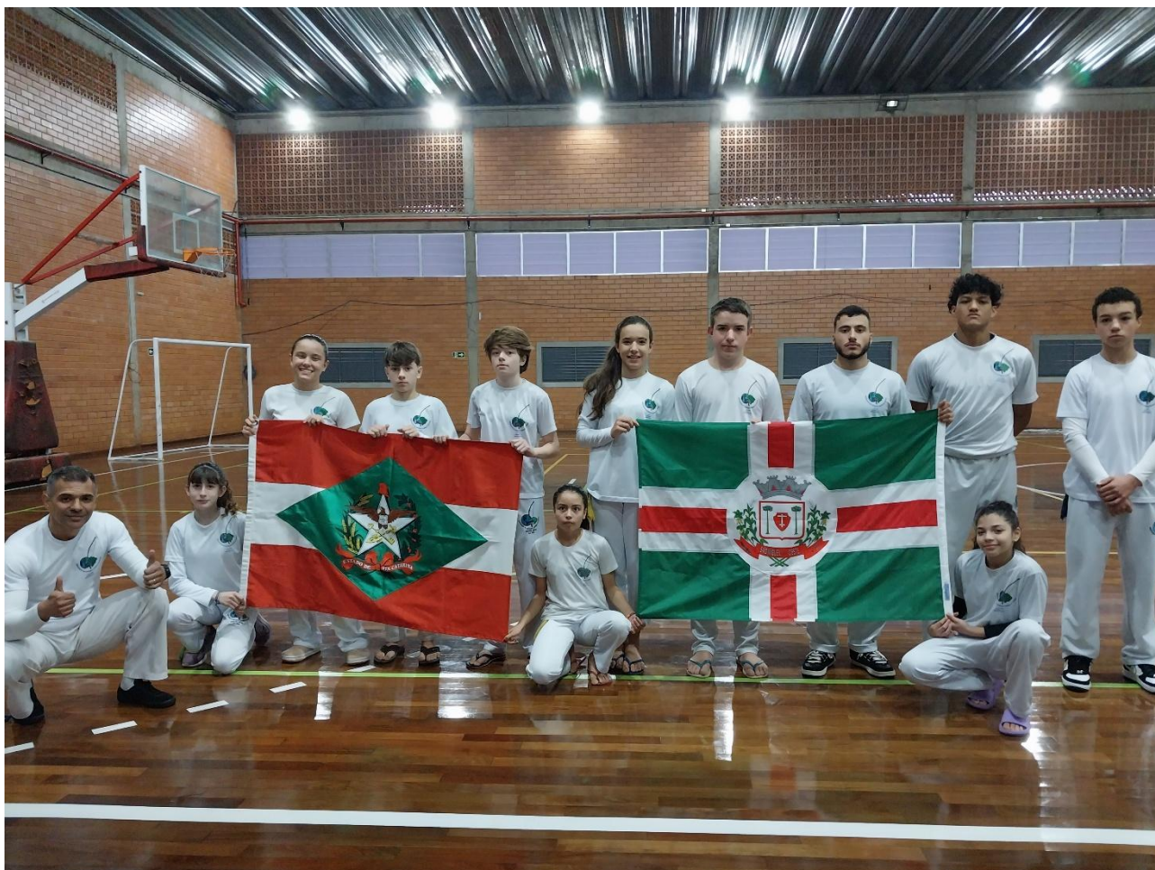
PARTICIPAÇÃO NA IV COPA OESTE DE CAPOEIRA EM FOZ DO IGUAÇU/PR, REPRESENTANDO SANTA CATARINA E SÃO MIGUEL DO OESTE.