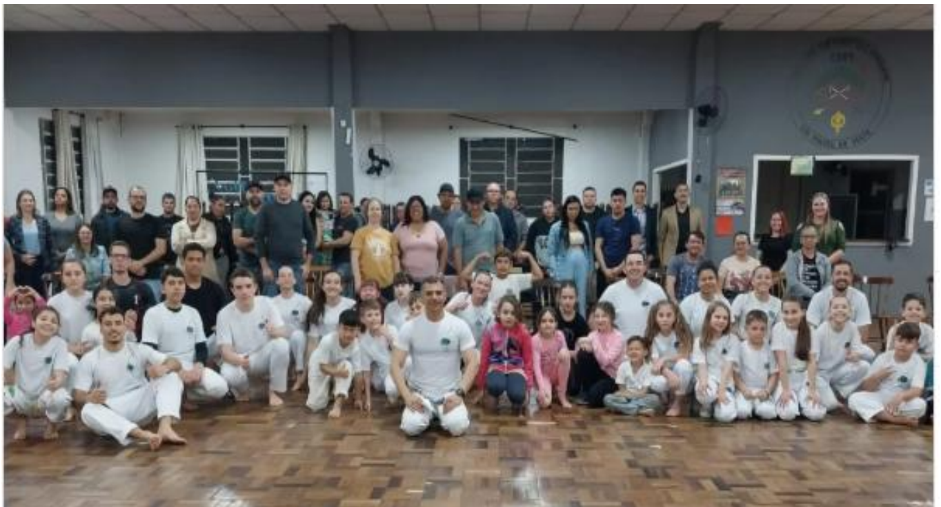
CLUBE MILITAR USSMO, BAIRRO SÃO JORGE