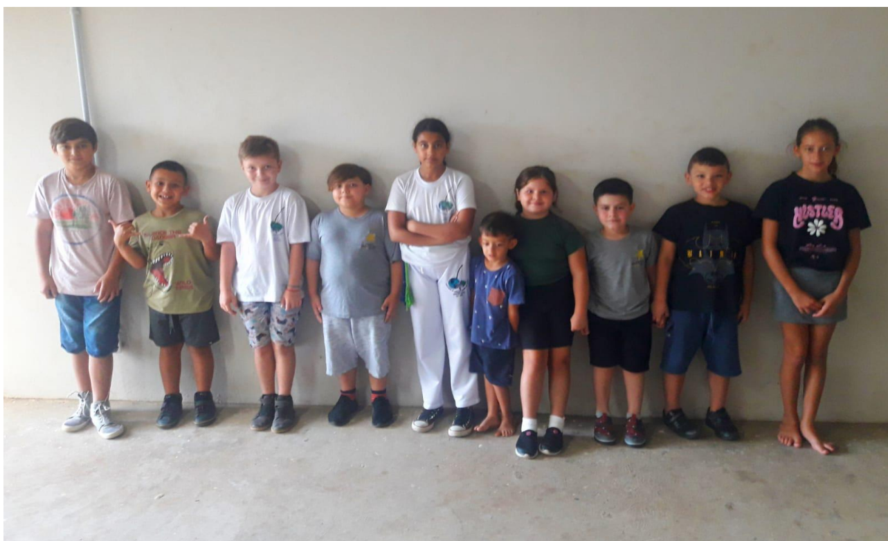
ESCOLA JUSCELINO KUBITSCHEK, BAIRRO ESTRELA