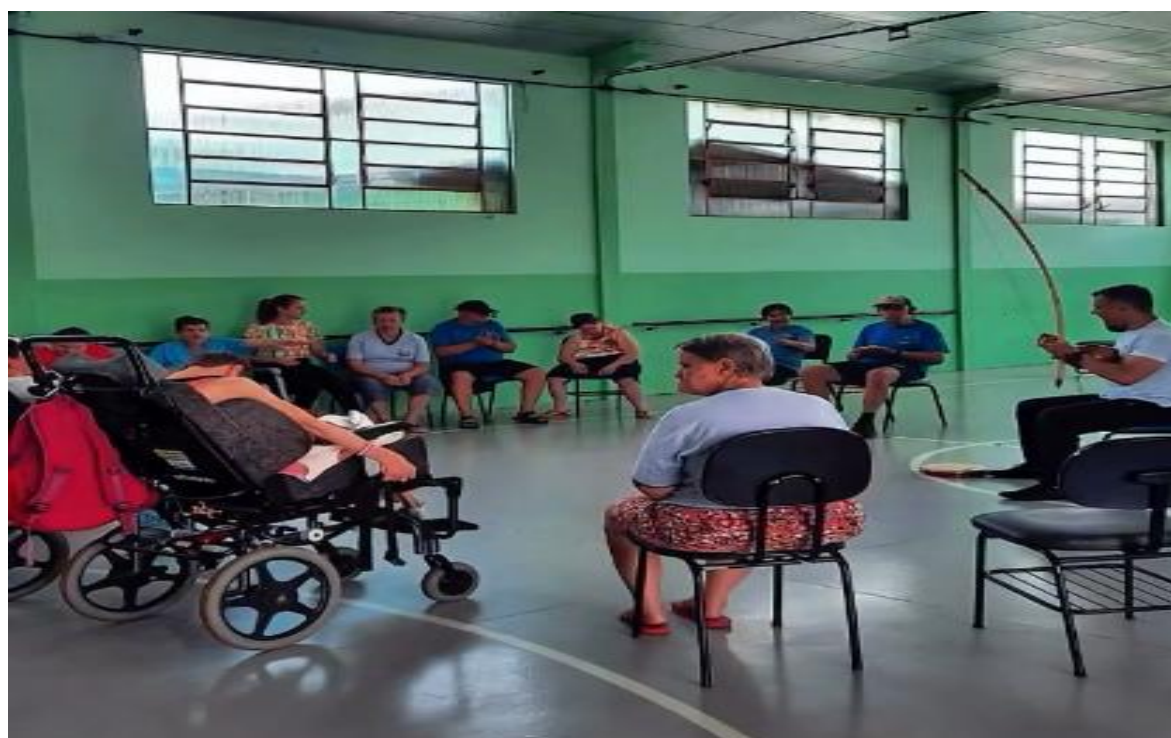
APAE SÃO MIGUEL DO OESTE, BAIRRO PEPERI