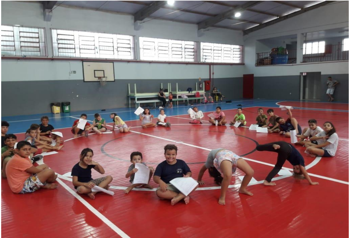
ESCOLA TRANQUILO JOSÉ RIGONI, BAIRRO ANDREATA