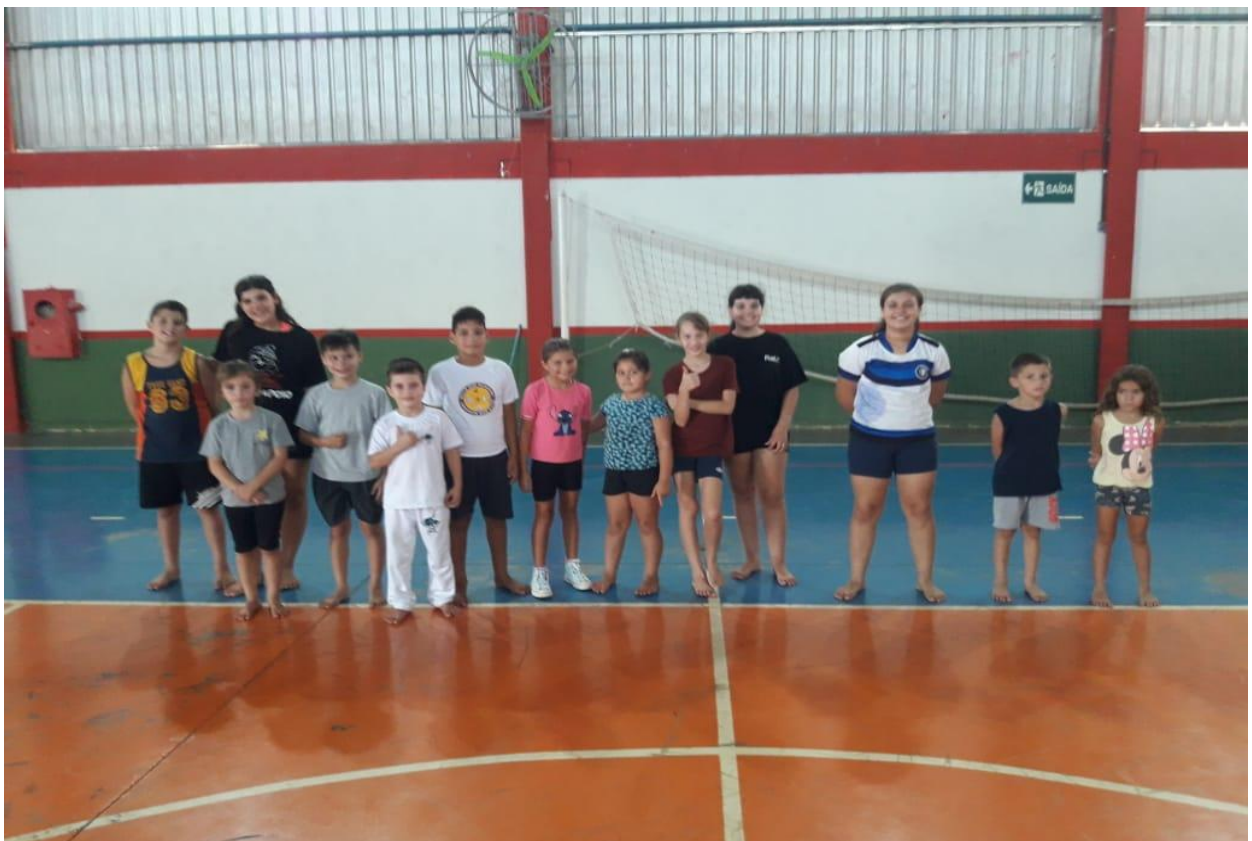
ESCOLA SÃO SEBASTIÃO, BAIRRO SÃO SEBASTIÃO