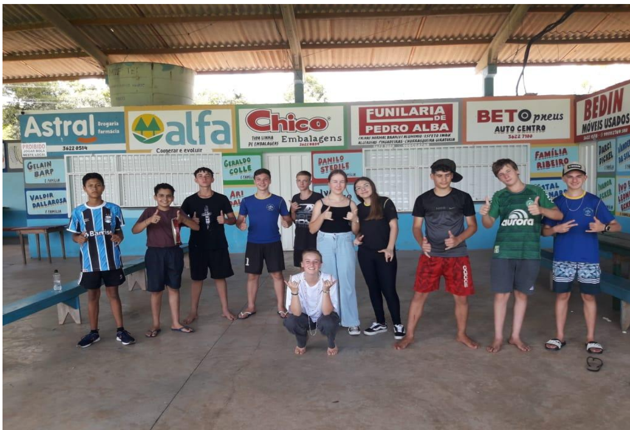
ESCOLA WALDEMAR VON DENTZ, LINHA CANELA GAÚCHA, TURMA DA TARDE