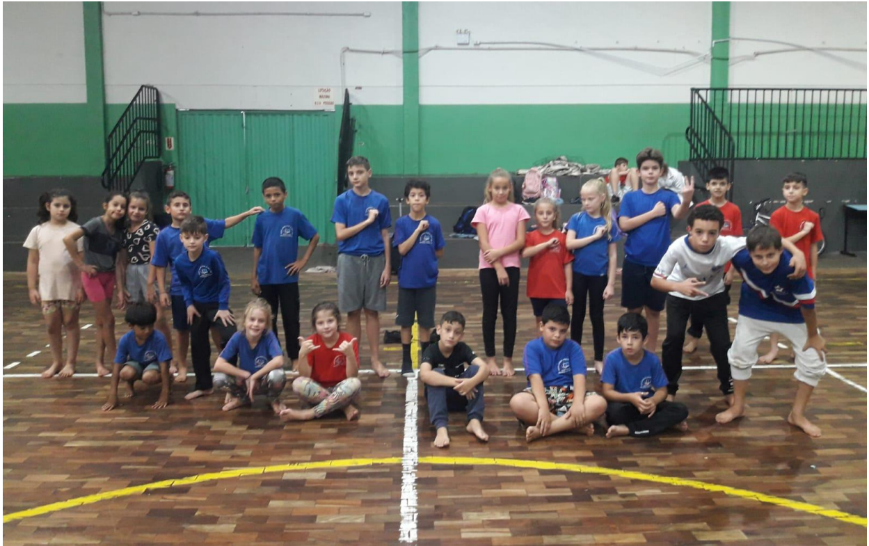
ESCOLA MARECHAL ARTHUR DA COSTA E SILVA, BAIRRO SALETE