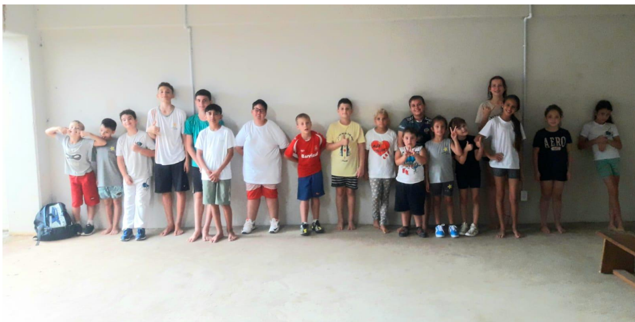
ESCOLA JUSCELINO KUBITSCHKEK, BAIRRO ESTRELA

INÍCIO DA OFICINA DE CAPOEIRA NAS ESCOLAS PÚBLICAS MUNICIPAIS, EM PARCERIA COM A SECRETARIA DE CULTURA DE SÃO MIGUEL DO OESTE.