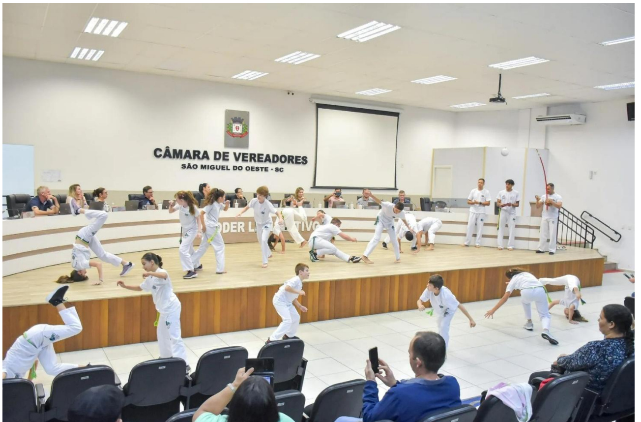
RECEBIMENTO DO TÍTULO DE UTILIDADE PÚBLICA MUNICIPAL NA CÂMARA DE VEREADORES, APRESENTAÇÃO PARA OS VEREADORES E PÚBLICO PRESENTE.