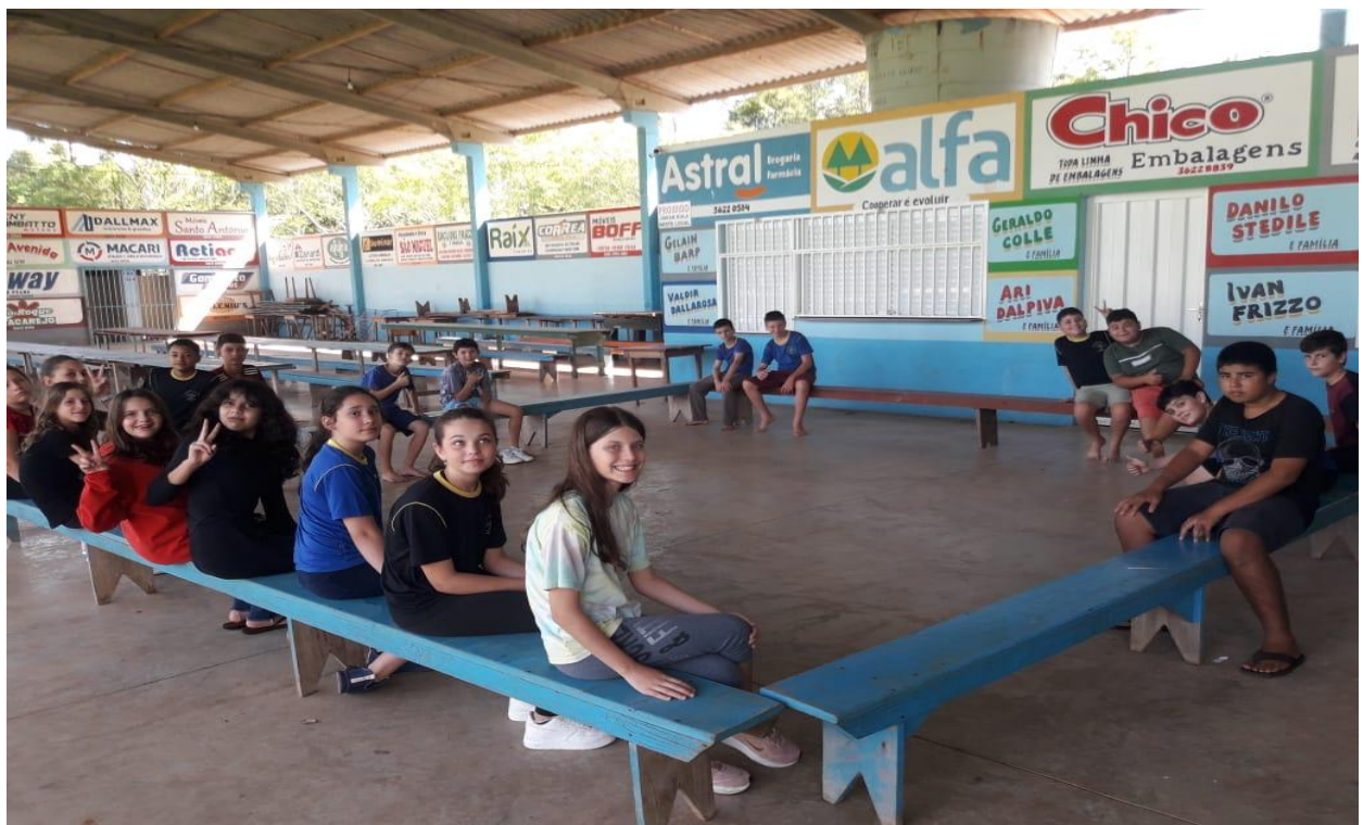
ESCOLA WALDEMAR VON DENTZ, LINHA CANELA GAÚCHA, TURMA DA MANHÃ