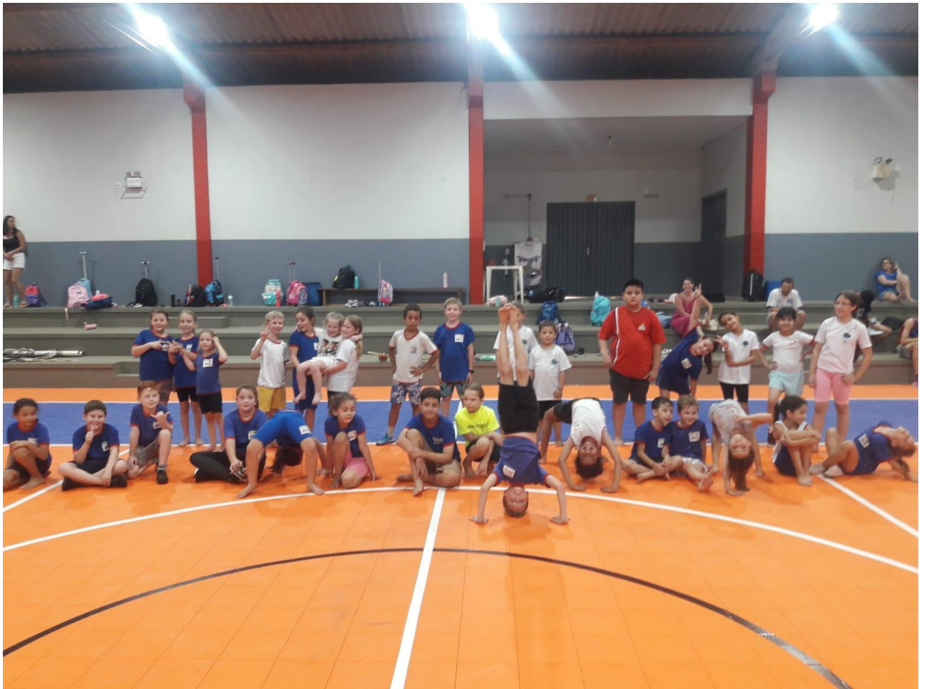
ESCOLA EMMA BALKE, BAIRRO CENTRO