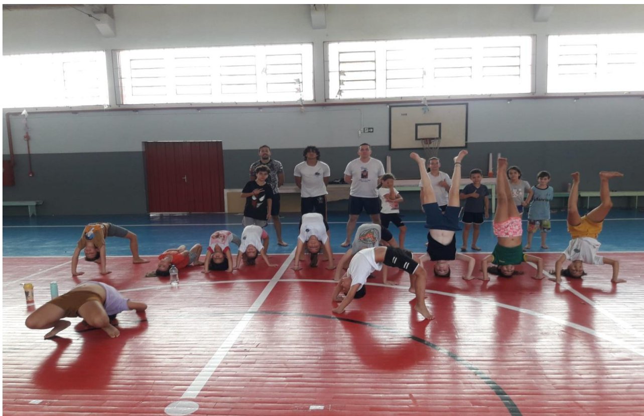
ESCOLA TRANQUILO JOSÉ RIGONI, BAIRRO ANDREATTA