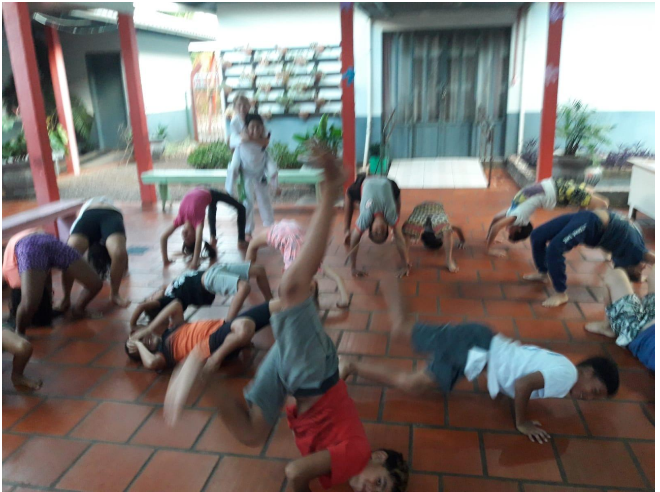
ESCOLA SÃO JOÃO BATISTA DE LA SALLE, VILA BASSO