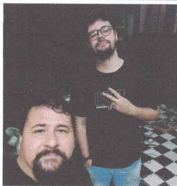
ENSAIO – 19/05/2025