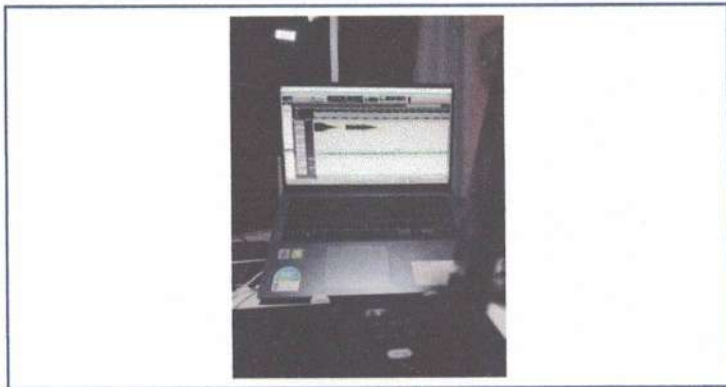
ENSAIO INDIVIDUAL - 22/05/2025