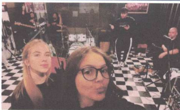
ENSAIO – 19/05/2025