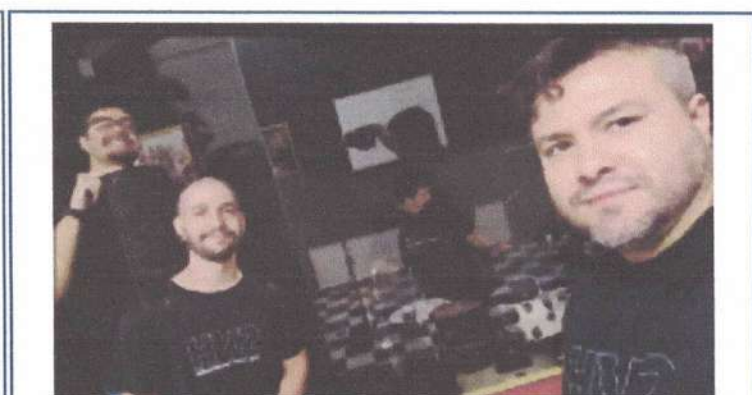
ENSAIO – 21/04/2025