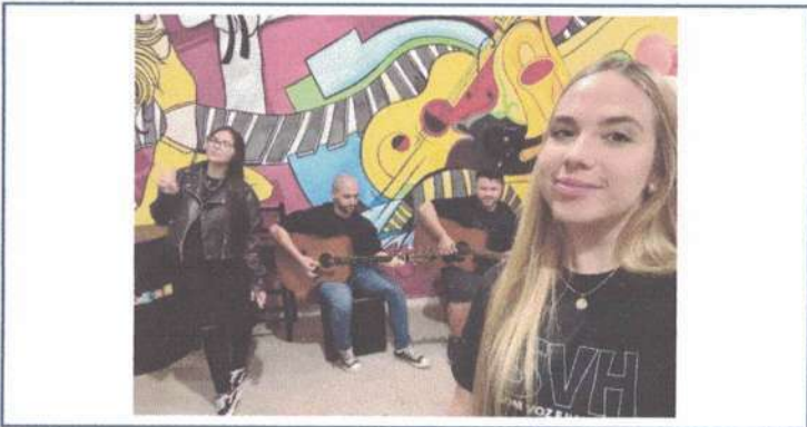
APRESENTAÇÃO SOM VOZ E HARMONIA ADULTO - 24/04/2025