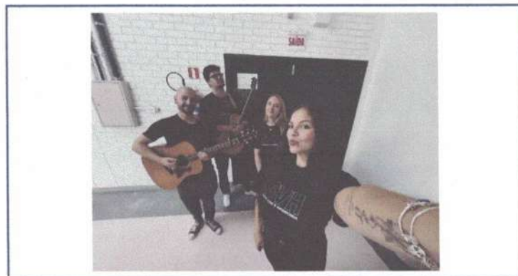
APRESENTAÇÃO HINO SVH ADULTO IFC - 20/05/2025