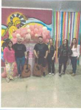
APRESENTAÇÃO NA CASA DA CULTURA- 24/04/2025