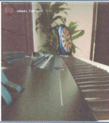
ENSAIO DE PIANO – 03/05/2025