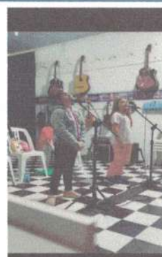
AULA DE VOZ - 07/05/2025