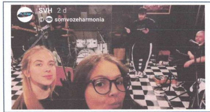
ENSAIO GRUPO ADULTO 30/05/2025