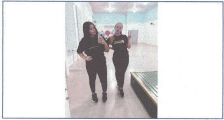
ENSAIO DE DANÇA - 17/04/2025