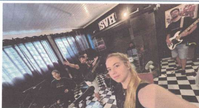
ENSAIO – 30/05/2025