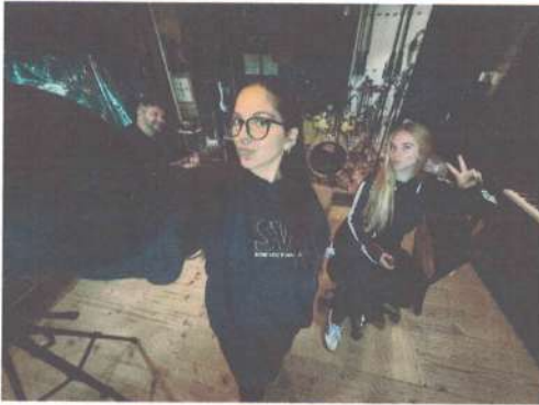
ENSAIO DE VOZ - 14/04/2025