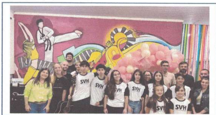
APRESENTAÇÃO GRUPO TEEN - 16/04/2025