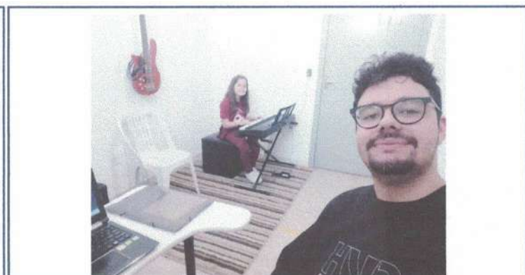
AULA DE TECLDO – 30/04/2025