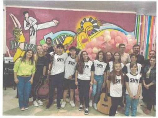
APRESENTAÇÃO SVH TEEN - 16/04/2025