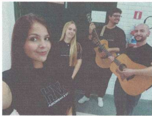
APRESENTAÇÃO IFC - 20/05/2025