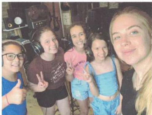
GRAVAÇÃO – 27/11/2024