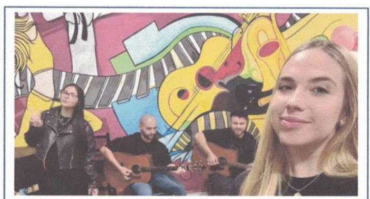
APRESENTAÇÃO GRUPO ADULTO – 24/04/2025