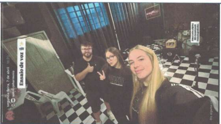
ENSAIO DE VOZ – 07/04/2025