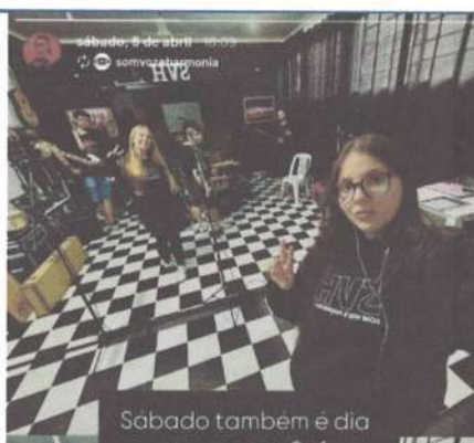
ENSAIO - 05/04/2025