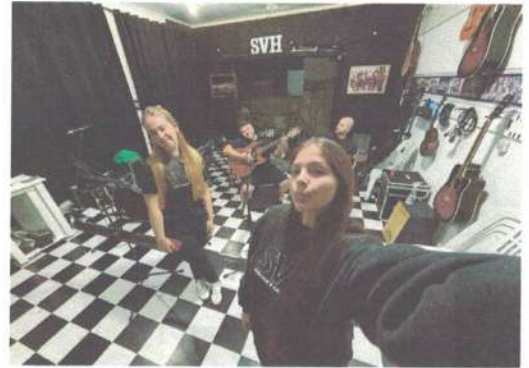
ENSAIO SVH ADULTO - 21/04/2025