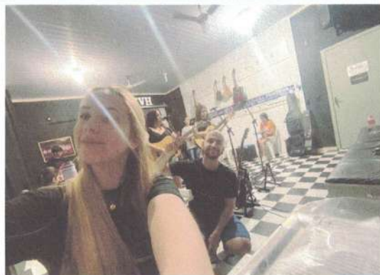
ENSAIO – 18/11/2024