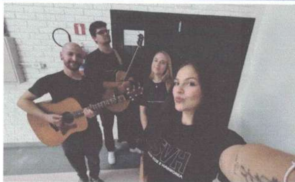
APRESENTAÇÃO – 20/05/2025