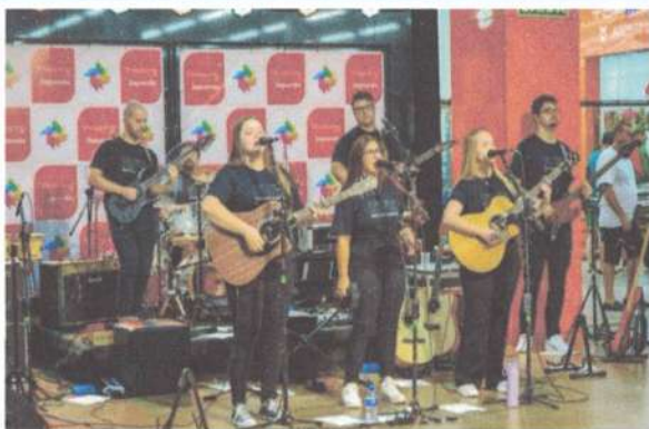
APRESENTAÇÃO NO SHOPPING – 24/11/2024