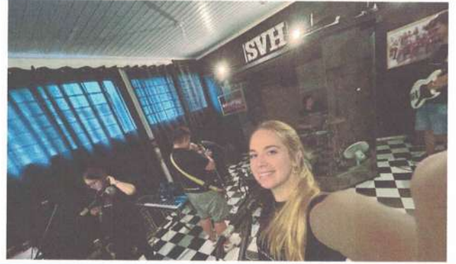
ENSAIO SVH ADULTO 11/04/2025