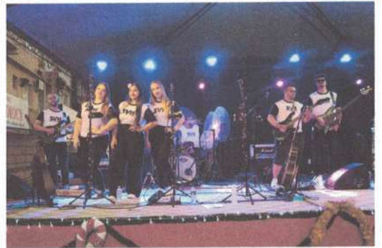
APRESENTAÇÃO – 05/12/2024