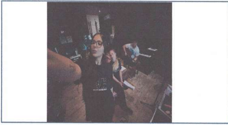
ENSAIO DE ARRANJOS - 14/04/2025