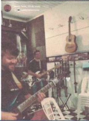
ENSAIO GERAL – 23/05/2025