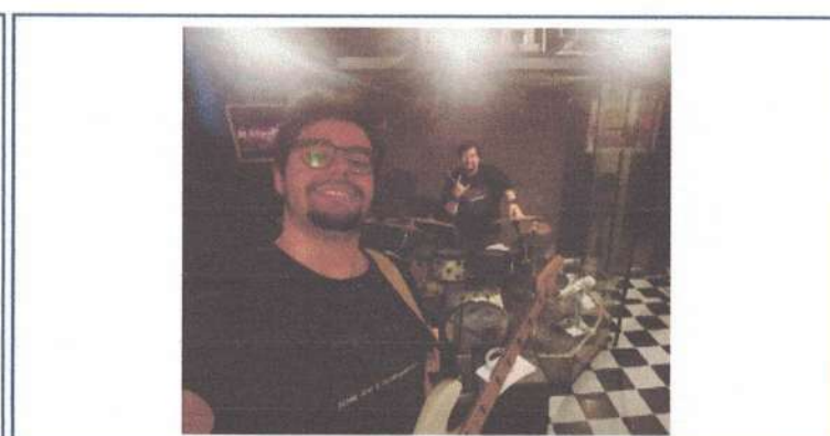
ENSAIO – 14/04/2025