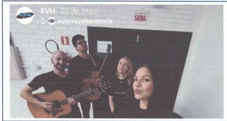
APRESENTAÇÃO HINO SANTA ROSA - 20/05/2025