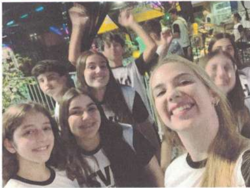
APRESENTAÇÃO – 13/12/2024

(Construção de Relatório) - (Associação) - (Aulas e Ensaios) - (Grupo Adulto) = 1