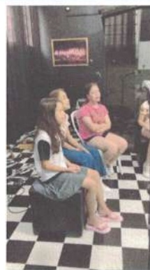
AULA DE VOZ – 26/11/2024