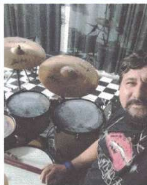
ENSAIO GRUPO SVH ADULTO - 05/04/2025