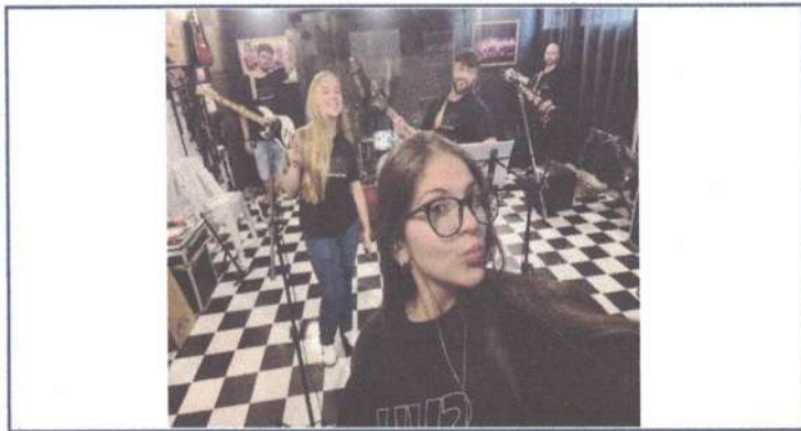
ENSAIO GERAL SVH ADULTO - 08/05/2025