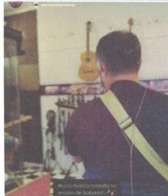
ENSAIO - 23/05/2025