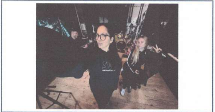
ENSAIO DE ARRANJOS - 21/04/2025