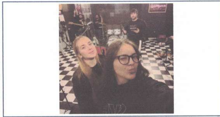
ENSAIO SVH ADULTO - 30/05/2025