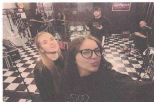
ENSAIO GRUPO SVH ADULTO – 30/05/2025