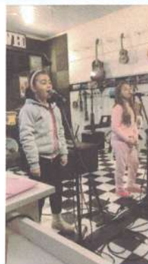
AULA DE VOZ – 05/11/2024