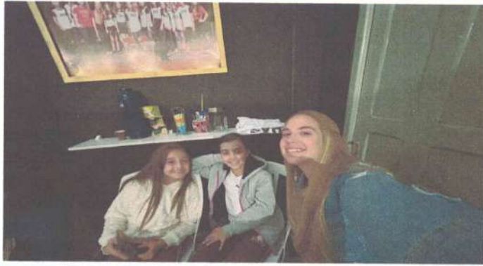
AULA DE VOZ - 14/04/2025