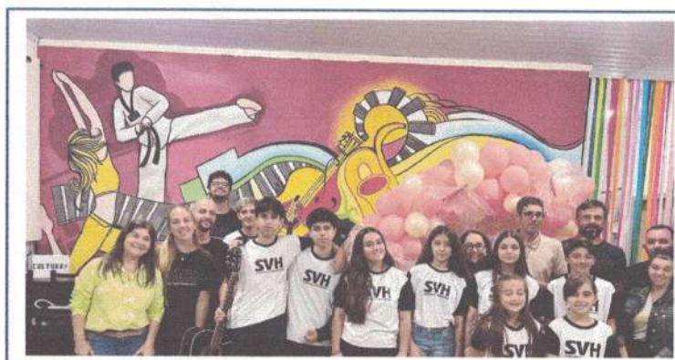
APRESENTAÇÃO – 16/04/2025