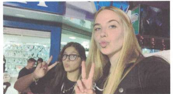
EVENTO DE DANÇA – 15/12/2024