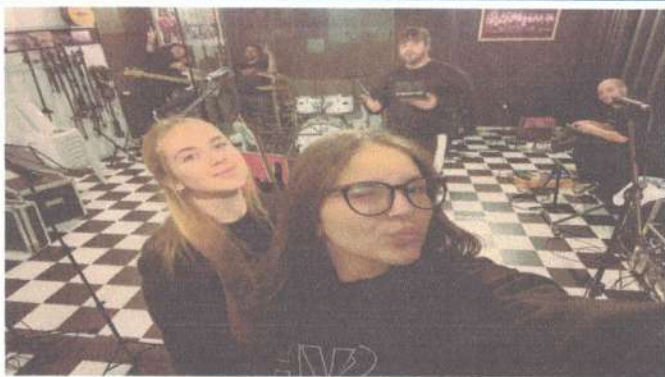
ENSAIO SVH ADULTO - 30/05/2025