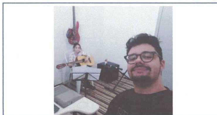
AULA DE VIOLÃO – 29/04/2025