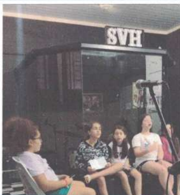
AULA DE VOZ – 06/11/2024