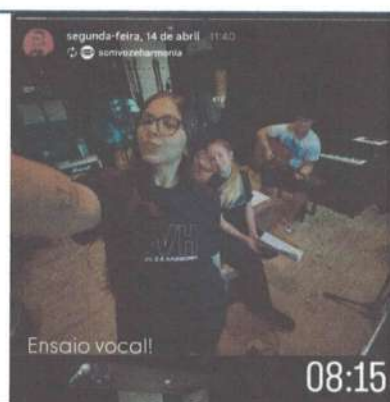
ENSAIO DE VOZ – 14/04/2025