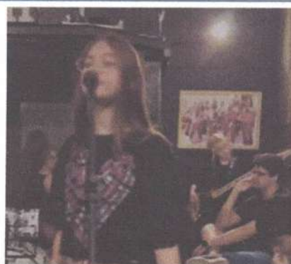
ENSAIO TEEN – 26/05/2025