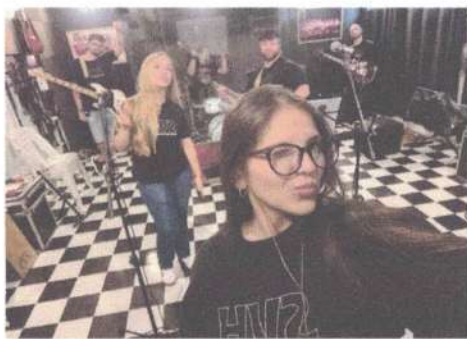
ENSAIO GRUPO SVH ADULTO – 08/05/2025