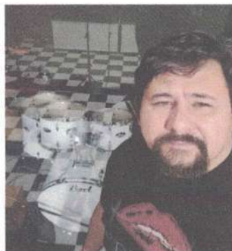
ENSAIO DE ARRANJOS SVH ADULTO – 05/05/2025