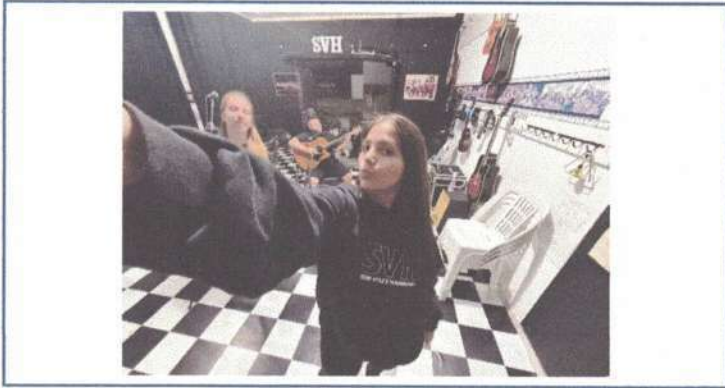
ENSAIO SOM VOZ E HARMONIA - 21/04/2025