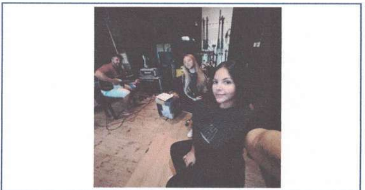
ENSAIO DE ARRANJOS - 28/04/2025