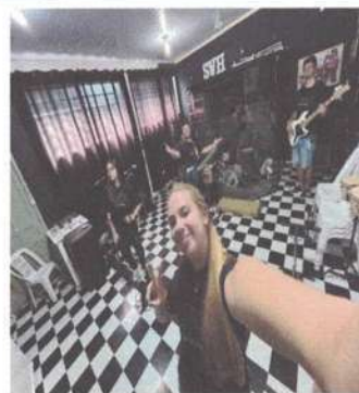
ENSAIO GRUPO SVH ADULTO - 28/04/2025