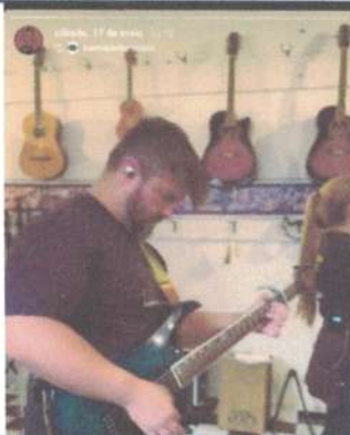
ENSAIO GERAL – 17/05/2025