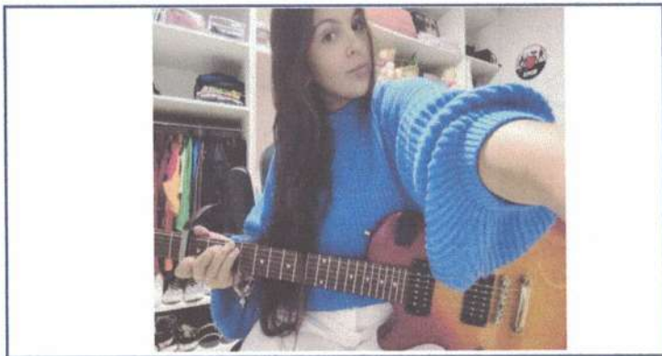
ENSAIO INDIVIDUAL - 11/05/2025