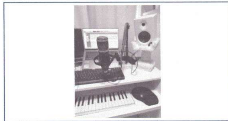
ENSAIO INDIVIDUAL - 29/05/2025