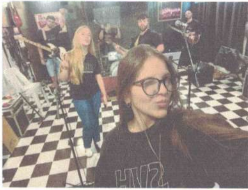
ENSAIO SVH ADULTO- 08/05/2025