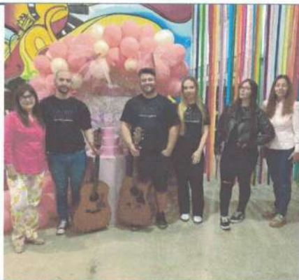
APRESENTAÇÃO (ANIVERSÁRIO DA CASA DE CULTURA) – 25/04/2025