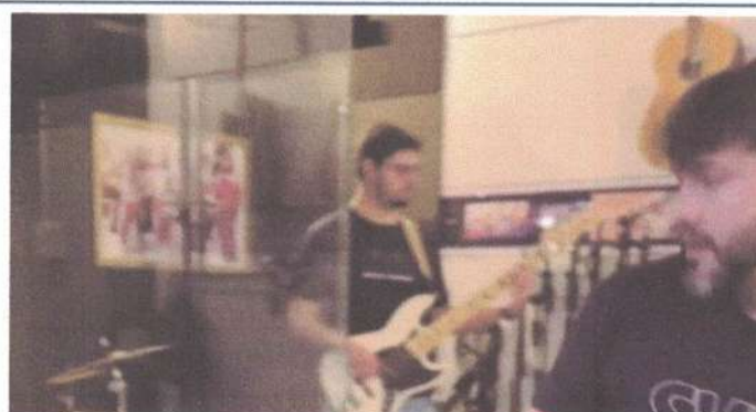
ENSAIO – 17/05/2025