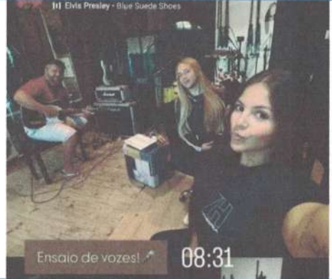
ENSAIO DE VOZ – 08/05/2025