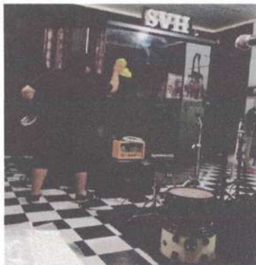
MANUTENÇÃO MONTAGEM E LIMPEZA DE EQUIPAMENTOS – 01/05/2025