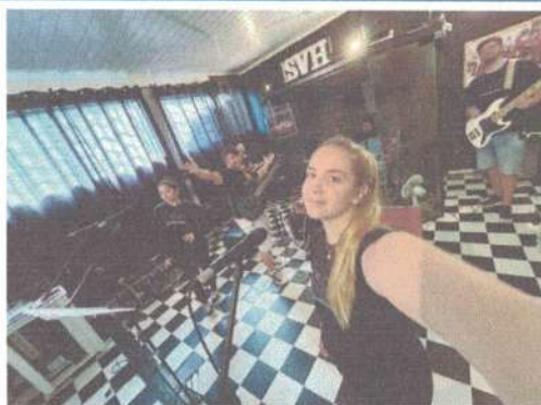
ENSAIO SVH ADULTO - 19/05/2025