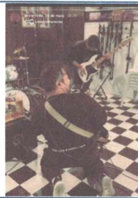
ENSAIO GERAL - 30/05/2025