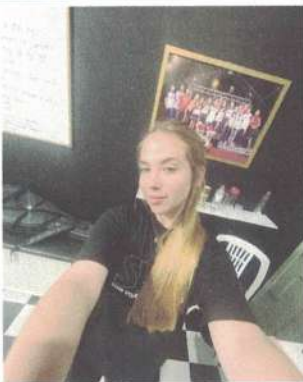
ENSAIO – 09/12/2024