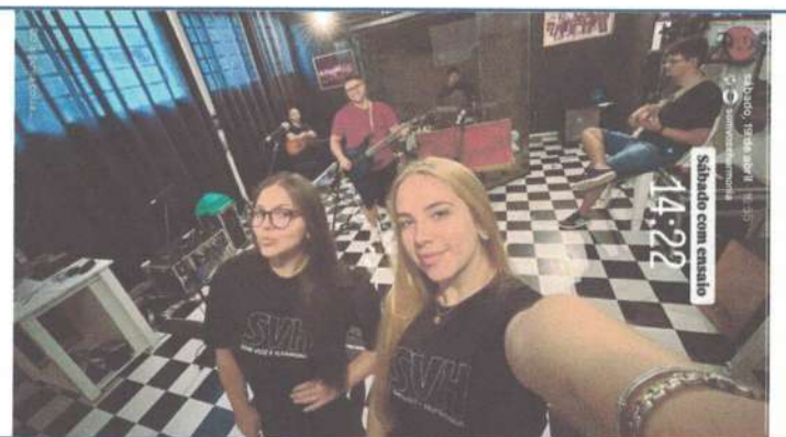
MANUTENÇÃO DA SALA – 19/04/2025