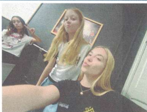
ENSAIO SVH TEEN 13/05/2025