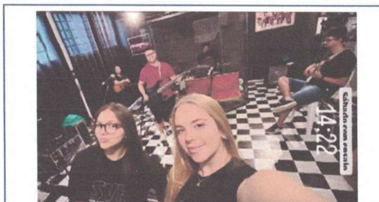
ENSAIO – 19/04/2025