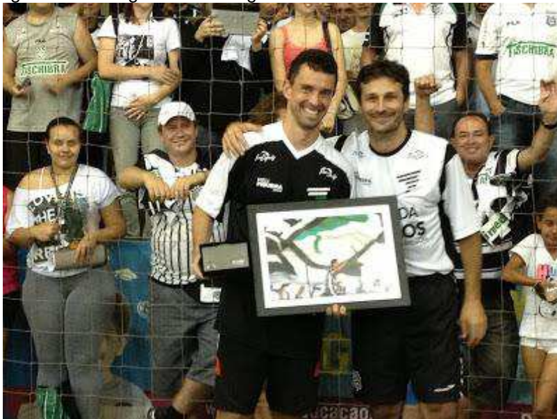
Figura 06: Entrega da homenagem