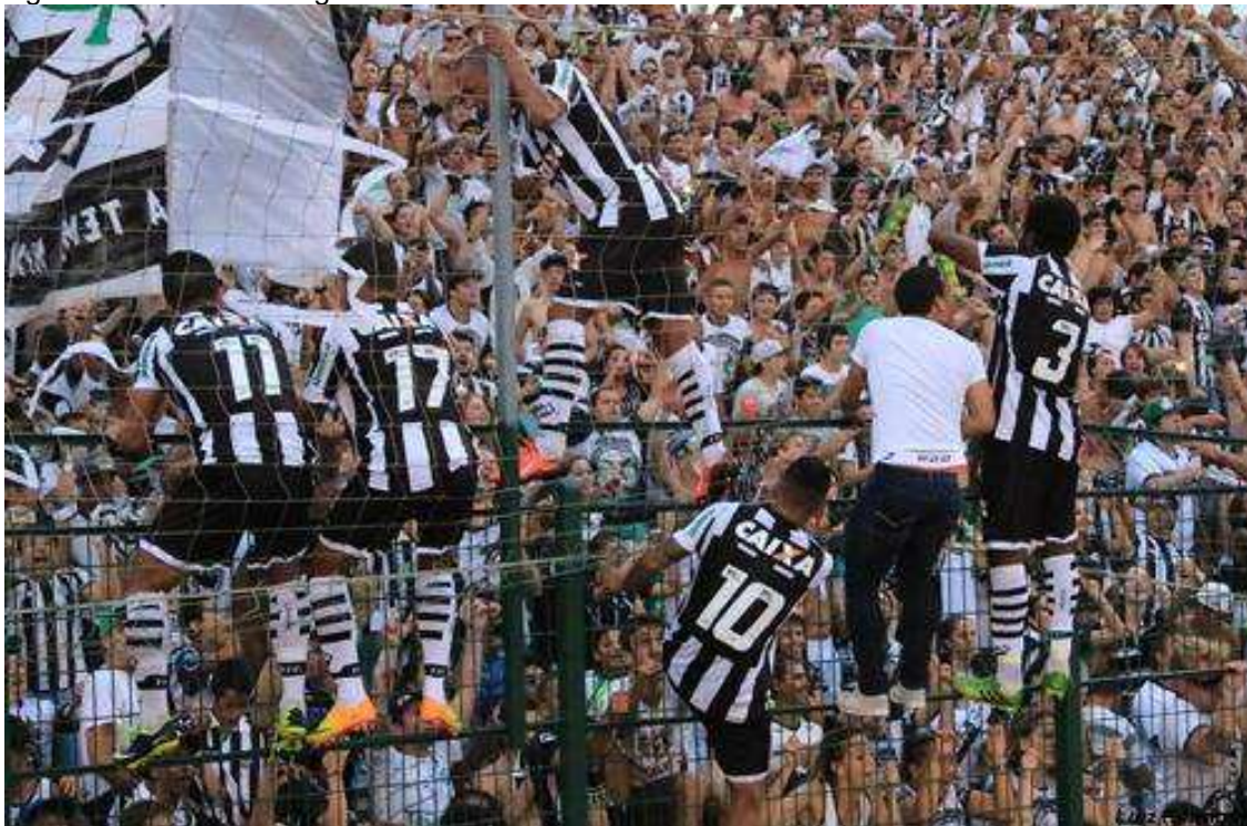
Figura 04: Torcida do Figueirense