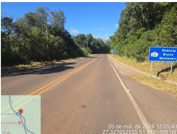
FT 01 – Rodovia SC 390 – Concórdia e Piratuba