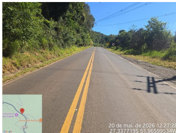
FT 02 – Rodovia SC 390 – Concórdia e Piratuba