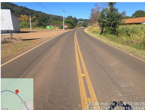
FT 05 – Rodovia SC 390 – Concórdia e Piratuba