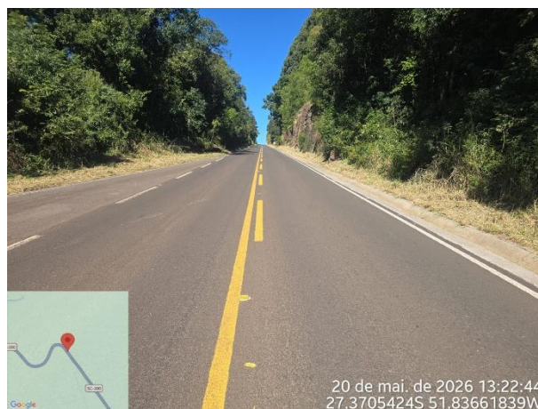
FT 06 – Rodovia SC 390 – Concórdia e Piratuba