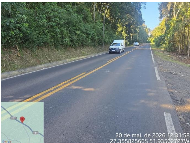
FT 03 – Rodovia SC 390 – Concórdia e Piratuba