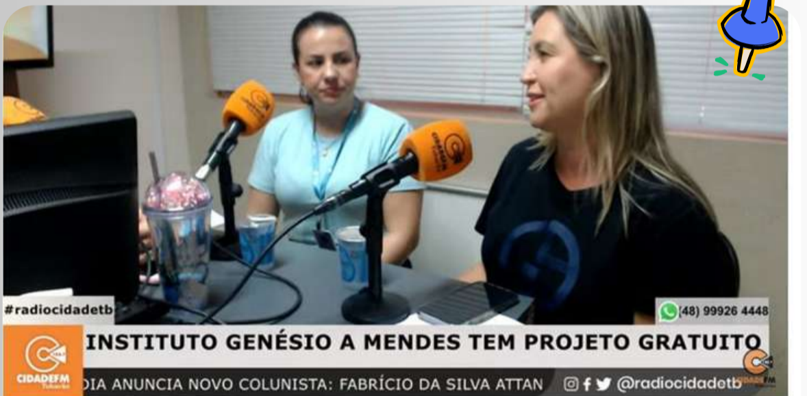
Estúdio Cidade - 24/07/2023