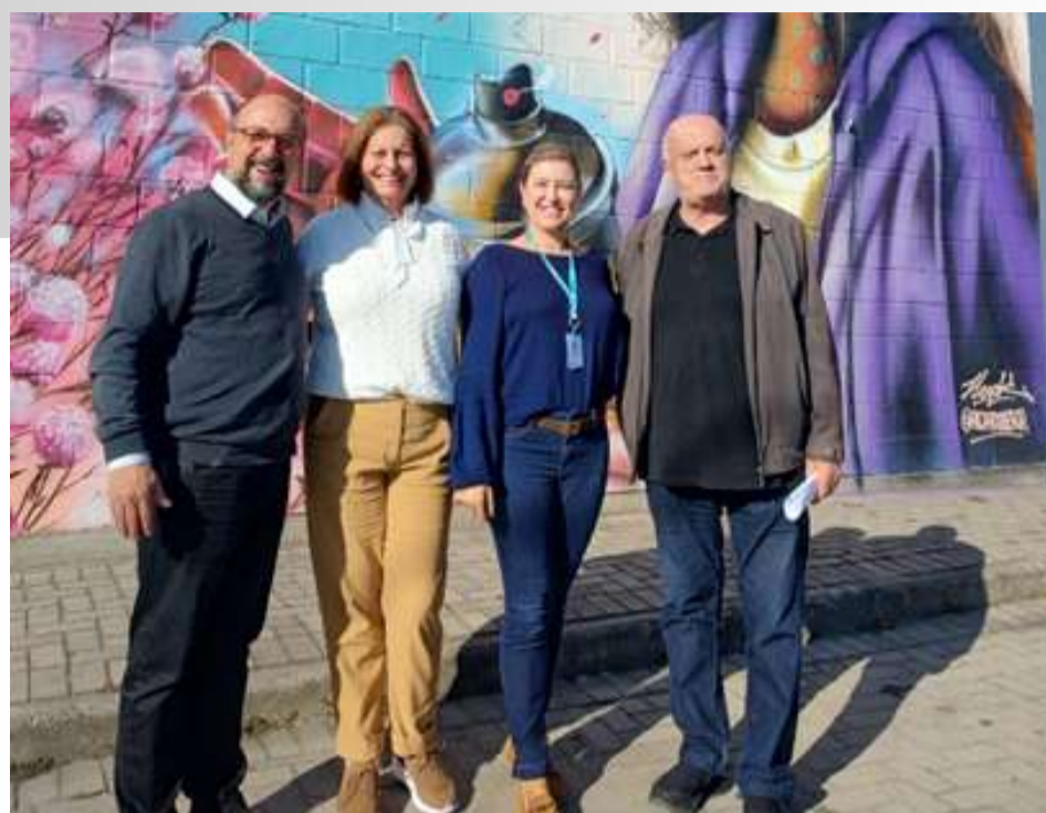
Fundação Educacional Joanna de Angelis

Na sequência registros de algumas visitas realizadas.