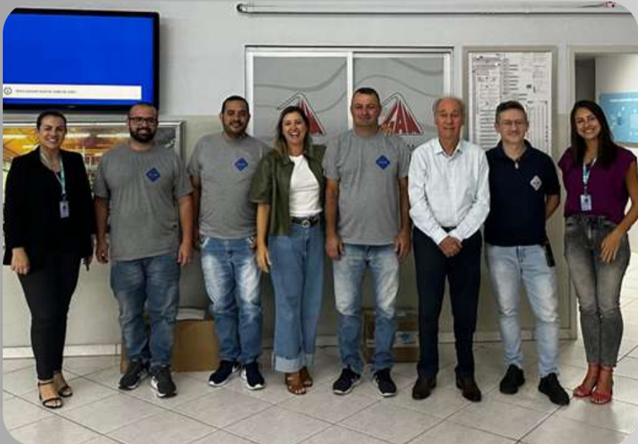
Diretores empresa GAM

O projeto tem como objetivo apresentar as ações do Instituto aos investidores, profissionais ligados diretamente ao Grupo GAM e pessoas da comunidade envolvidas com a causa.