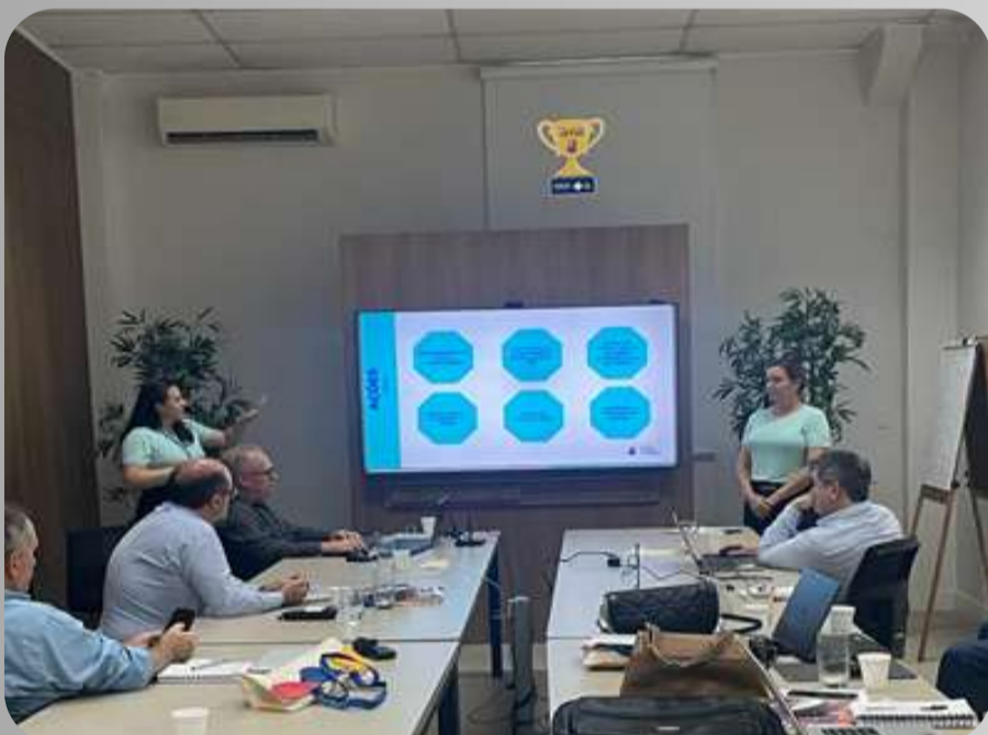
Conselho Consultivo Empresa GAM