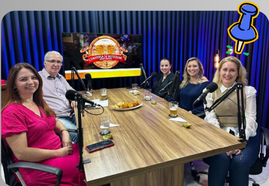
Conversa de Botequim - 17/08/2023