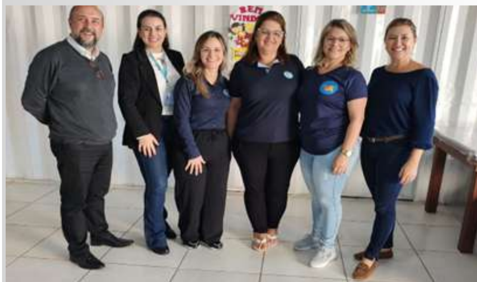
Associação Vida e Arte