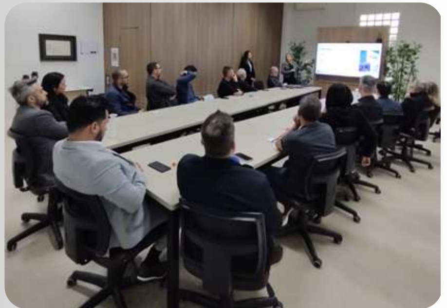
Centro de Distribuição empresa GAM