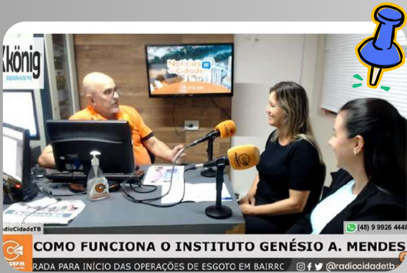
Rádio Cidade 14/10/2023