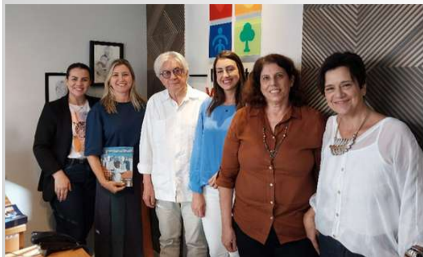
Instituto Padre Vilson Groh