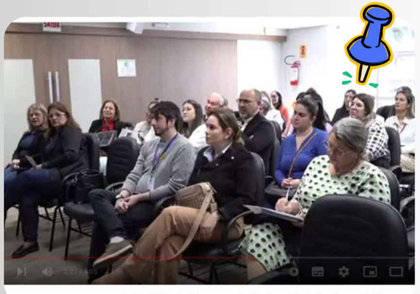
Programa de Aceleração do Instituto GAM