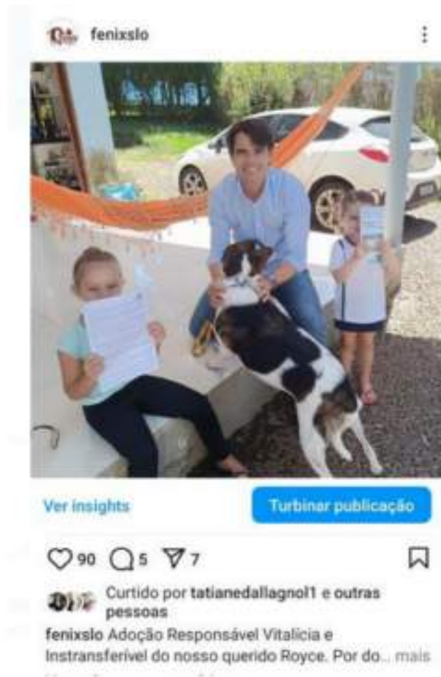
Figura 12.1 – Adoção Responsável, vitalícia e intransferível.

São Lourenço do Oeste, 21 de agosto de 2024.