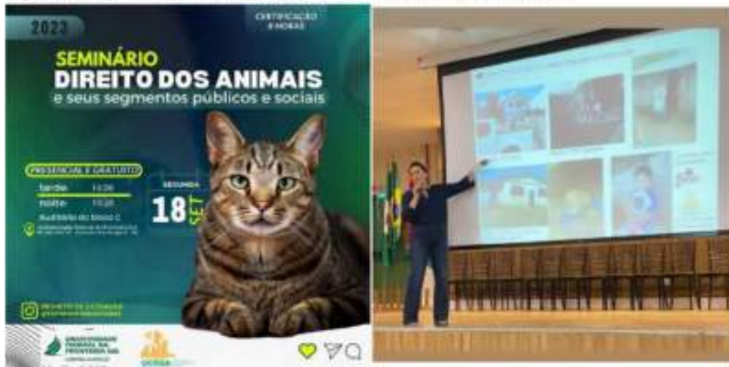
Figura 3.1- Arte de divulgação do evento e presidente da entidade fênix palestrando no auditório da Universidade Federal da Fronteira Sul em Chapecó.

3.1 Participação como Palestrante em Seminário "Direito dos Animais e seus Segmentos Públicos e Sociais" , na Universidade Federal da Fronteira Sul – UFFS, Chapecó, SC. Título da Palestra: Controle Populacional de Cães e Gatos pelo Método Busca Ativa em Comunidades Carentes.