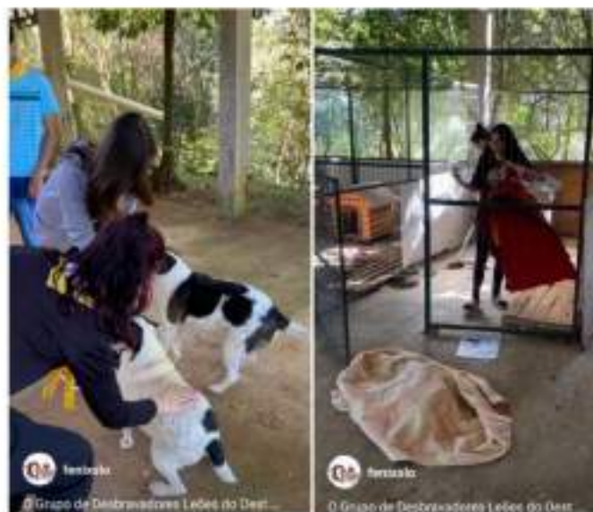
Figura 2.1- Grupo de jovens adventistas realizando visita e atividades em Lar Temporário da entidade.

2.1 Envolvimento de Grupo de jovens em práticas de limpeza, interação, educação e cuidados com os animais em Lar Temporário à espera de adoção.