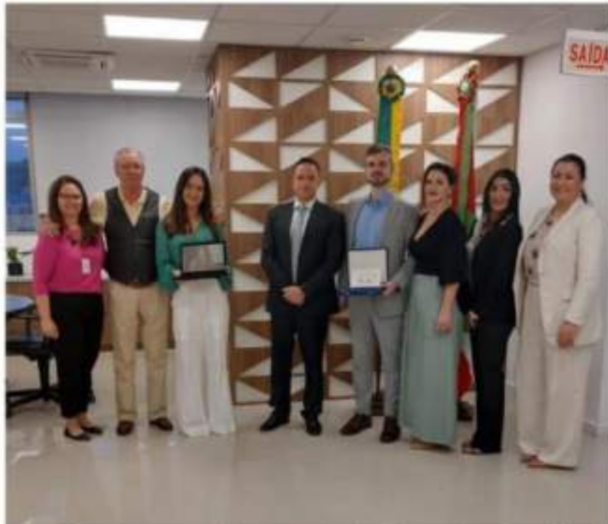
Figura 4.2 – Reunião com ativistas estaduais, Procurador Geral da Justiça e Promotores de Justiça.