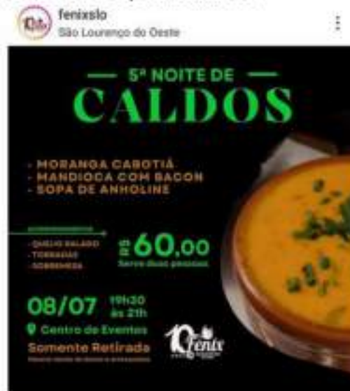
Figura 1.4 – Jantar de sopas produzido pelas próprias voluntárias no intuito de arrecadar fundos para custear as atividades da entidade.

1.4 Evento social organizado para levantar recursos para custear castração, vacinas, tratamentos médicos, alimentação e medicação dos animais assistidos pela entidade.