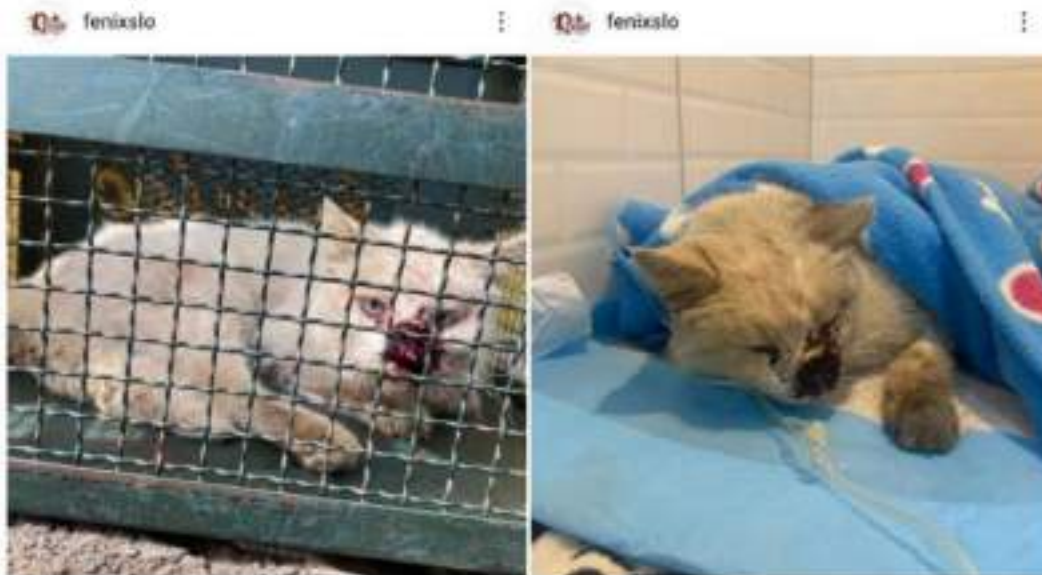
Figura 2.3 – Felino resgato em estado de emergência.