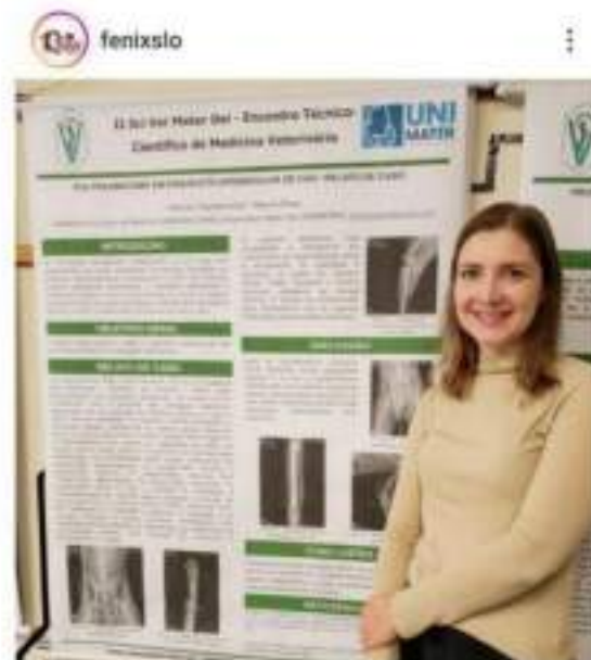
Figura 1.3 – Voluntária Dra. em Zootecnia e estudante de Medicina Veterinária, levando à sua instituição de ensino experiências do trabalho voluntário.

1.3 Artigo Técnico Científico apresentado ao Curso de Medicina Veterinária da Unimater, sobre cirurgia ortopédica em cão de rua atropelado.