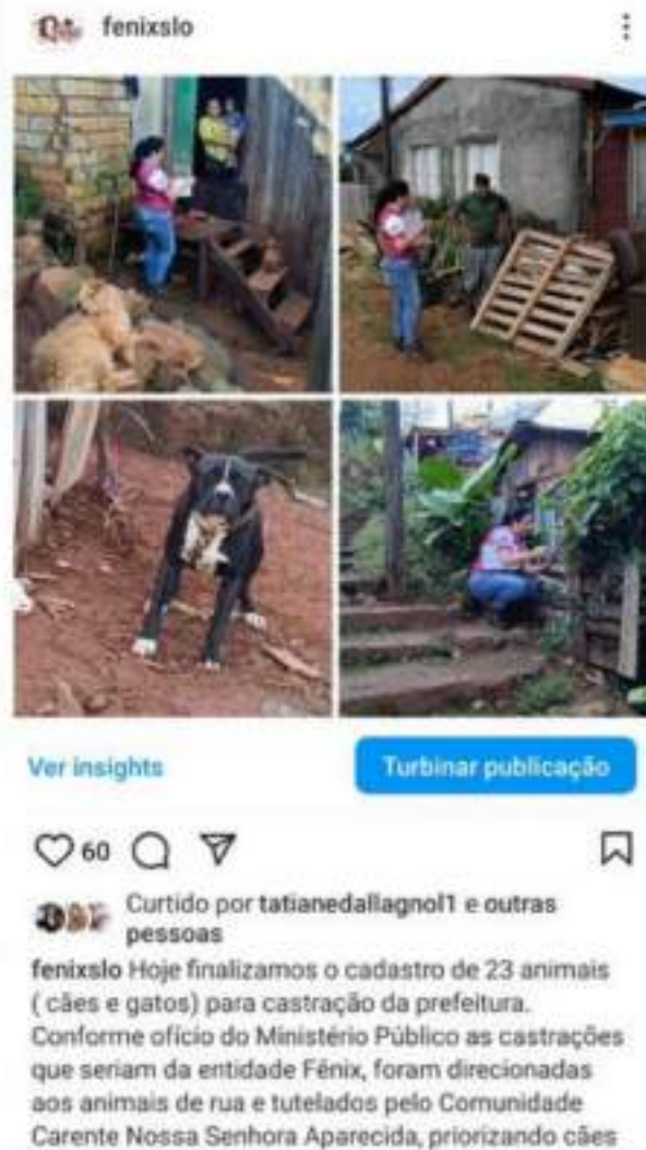
Figura 10.1 – Cadastro de Busca Ativa em Comunidades Carentes visando controle populacional, priorizando cães das raças pit bulls.