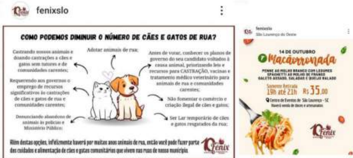
Figura 4.1 – Arte de divulgação do evento, juntamente ao material educativo preparado para apresentar aos participantes.

4.1 Evento para arrecadar fundos juntamente a material educativo à população sobre controle populacional, lares temporários e cães e gatos comunitários.