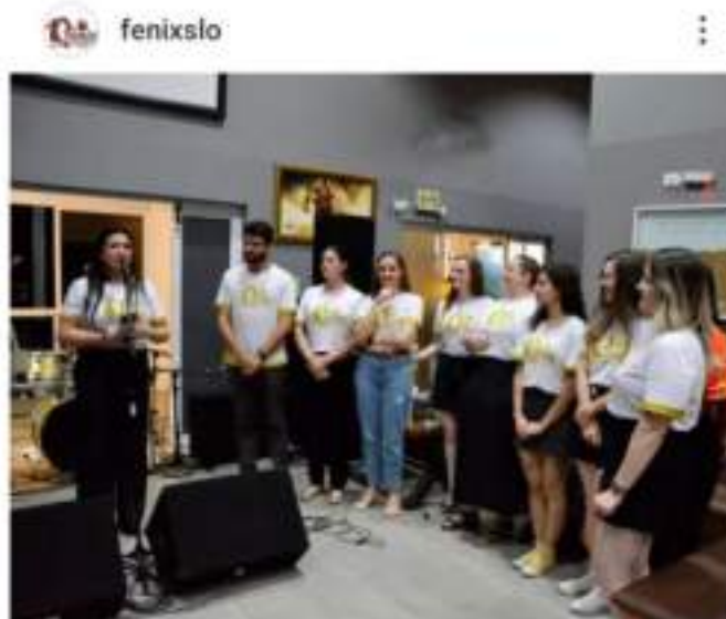
Figura 5.1 – Evento de celebração e reconhecimento.

5.1 Celebração de 10 anos de atuação no município com autoridades presentes e apresentação das ações desenvolvidas ao longo dos anos na proteção e defesa dos direitos dos animais.