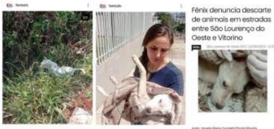
Figura 3.2 – Pit Bull com orelhas mutiladas e descartado em estrada rural.

3.2 Denúncia aos órgãos competentes (prefeitura e MPSC), sobre abandono, mutilação de animais e ausência de políticas públicas para prevenção em doenças.