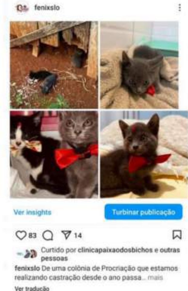
Figura 9.1 – Felinos de colônia felina.