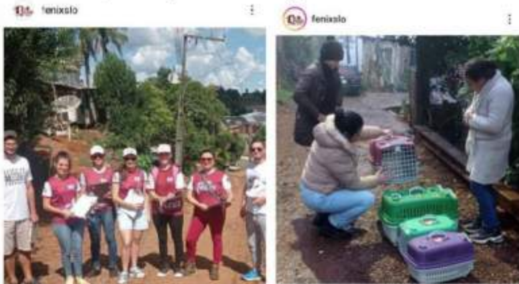
Figura 1.1 – Cadastro de cães e gatos e devolução pós castração aos seus tutores carentes (ao final do dia), pós cirurgia, acordados e com as devidas medicações.

1.1 Projeto Busca Ativa – Controle Populacional de Cães e Gatos em Comunidade Carente: Após mapeamento e cadastro dos animais em levantamento de campo, atributos referentes ao contexto de Saúde Única são registrados e geoprocessados, para posterior retorno, esterilização em clínica veterinária local, e devolução ao local de origem e aos tutores carentes.