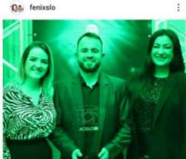
Figura 2.2 – Premiação Acislo por Responsabilidade Social.