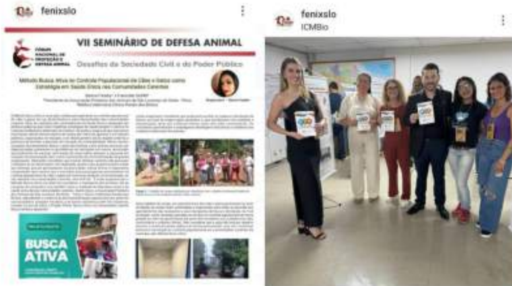
Figura 11.1 – Participação e apresentação de trabalhos no Fórum Nacional em Brasília.