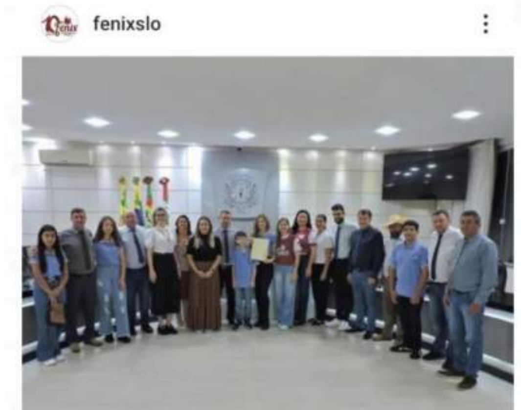
Figura 5.2 – Aprovação do Projeto de Lei "Semeando Saúde Única nas Crianças na Assembleia Legislativa do município.

O Projeto de Lei "Semeando Saúde Única nas Crianças" é uma evolução ao nosso município em Políticas Públicas voltadas à Causa Animal. Dentro do conceito universal que integra as três saúdes – humana, ambiental e animal, o Bem-Estar deve ser para todos, visando garantir uma sociedade justa a todas as formas de vida. Nossa entidade se sente lisonjeada em participar de um projeto de tamanho impacto educacional. Parabéns à propositura do Legislativo Mirim, estes jovens legisladores que com coragem e força de vontade escolheram a causa animal como tema de suas jornadas em nosso legislativo, no presente ano. Outro ponto a se observar é a união de forças: Um lindo projeto realizado pelo Parlamento Jovem, Ministério Público, mais Sociedade Civil Organizada - Fênix. Esta parceria reflete o quanto a Causa