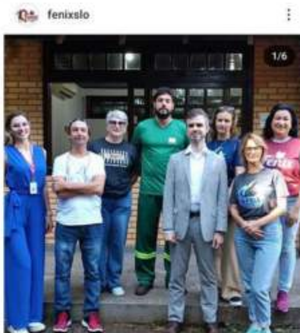
Figura 7.1 – Grupo de visita técnica (MPSC, Movimento Cadeia Para Maus Tratos, Servidores Públicos de Francisco Beltrão e Membros de Sociedade Civil Organizada)

maus tratos. Não defende a ideia de abrigos, trabalha com cães Comunitários e CED. A visita teve por finalidade conhecer a estrutura pública de Francisco Beltrão - PR, bem como trocar conhecimentos técnicos, operacionais e administrativos. Nosso município de São Lourenço do Oeste está em fase de execução de Termo de Ajuste de Conduta - TAC para o CENTRO de Reabilitação Animal, o qual será uma estrutura pública, com finalidade de atender animais de rua e comunidades carentes, controle populacional, tratamentos médicos, bem como centralizar políticas públicas de Bem-estar Animal. Portanto, conhecer na prática como outros municípios administram e atuam na causa animal é muito importante. Estamos gratos por mais esta oportunidade.