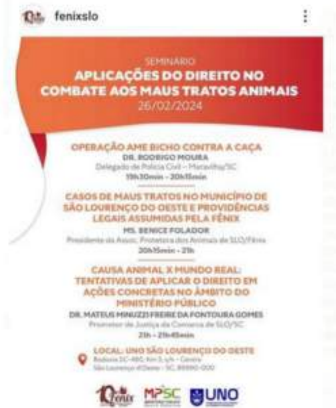
Figura 8.1 – Seminário de ações integradas visando esclarecer, educar e promover o Direito dos Animais.