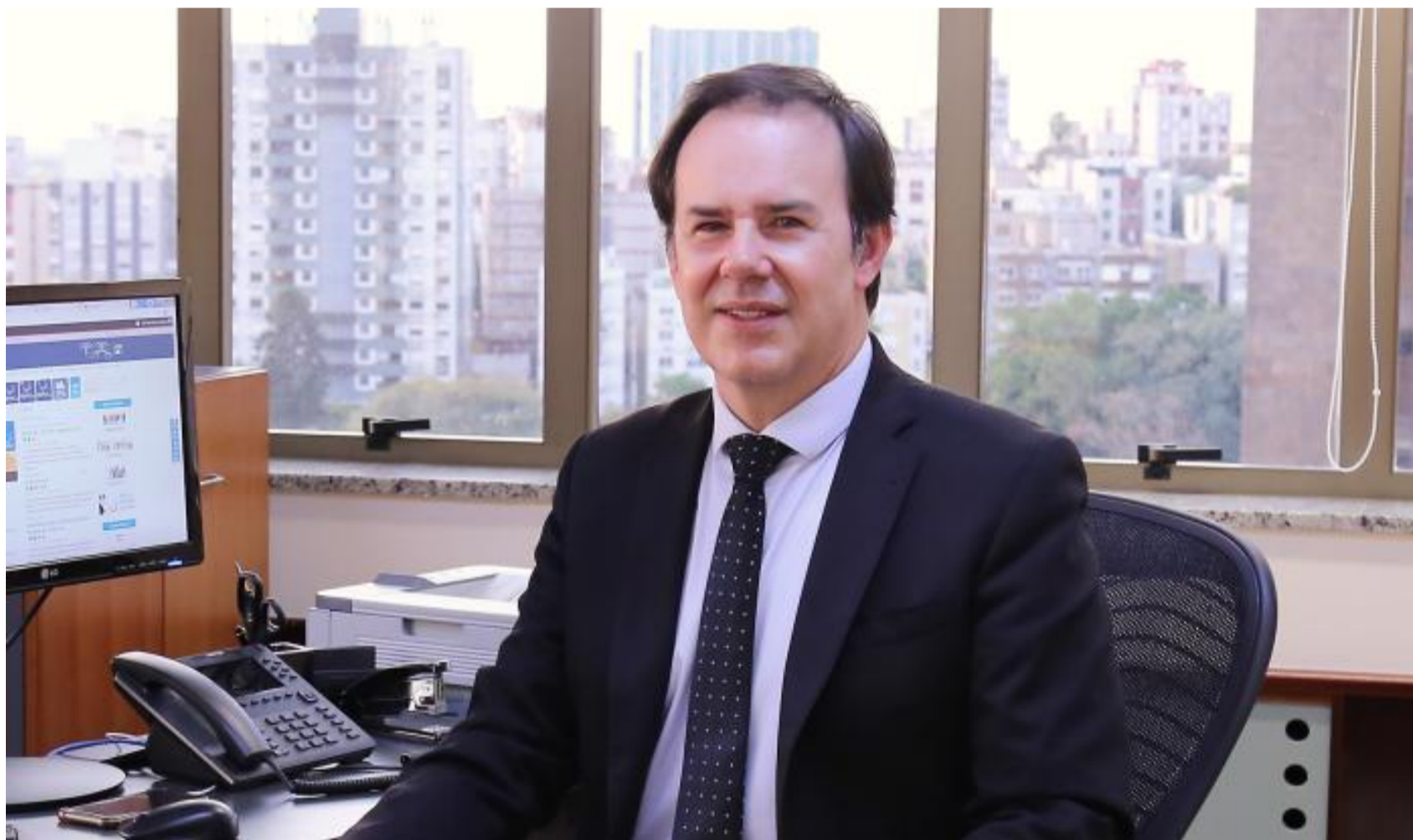
Presidente do TRF-4 autoriza obras da ponte da Lagoa e faz Justiça real – Foto: Divulgação

O Tribunal Regional Federal de Porto Alegre está distante de Florianópolis mais de 460 km. Mas seus desembargadores indicam mais sensibilidade, mais bom senso e conhecimento dos reais problemas da população de Santa Catarina do que alguns juízes federais e procuradores da República que atuam na capital do Estado.