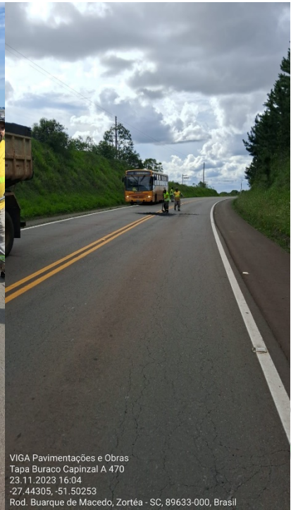
VIGA Pavimentações e Obras Tapa Buraco Capinzal A 470 23.11.2023 16:04 -27.44305, -51.50253 Rod. Buarque de Macedo, Zortéa - SC, 89633-000, Brasil