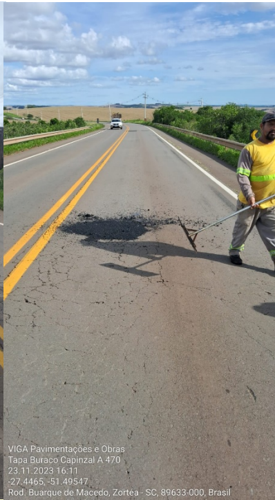
VIGA Pavimentações e Obras Tapa Buraco Capinzal A 470 23.11.2023 16:11 -27.4465, -51.49547 Rod. Buarque de Macedo, Zortéa - SC, 89633-000, Brasil