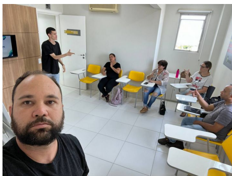
GRUPO ENSINO DE LIBRAS PARA FAMILIARES