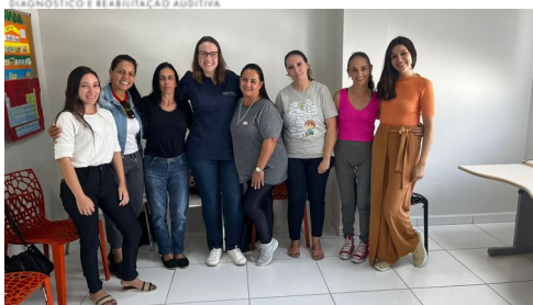
GRUPO DE APOIO E ORIENTAÇÃO FAMILIAR COM EQUIPE MULTIDISCIPLINAR