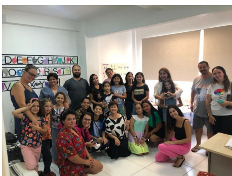
GRUPO DE APOIO E ORIENTAÇÃO PSICOSSOCIAL FAMILIAR