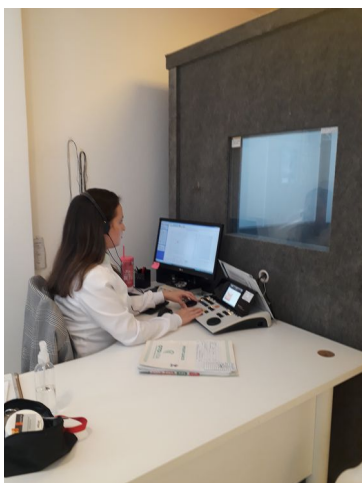
EXAME DE AUDIOMETRIA