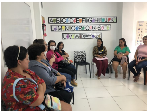
ACOMPANHAMENTO PSICOSSOCIAL FAMILIAR