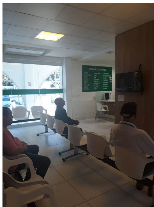
ACOLHIMENTO E RECEPÇÃO