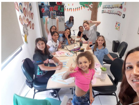
OFICINA EXPLORATÓRIA DE LIBRAS