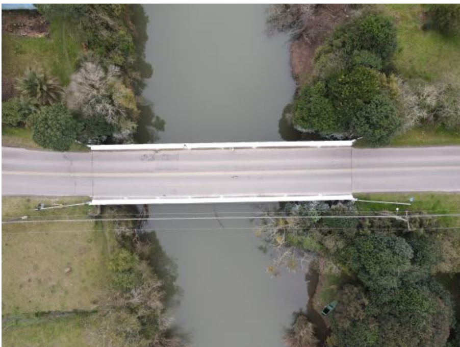
Figura 4 - Vista aérea da ponte.