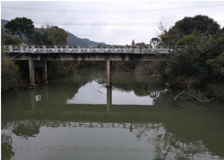
Figura 2 - Vista lateral da ponte. Destaque para a seção útil disponível.