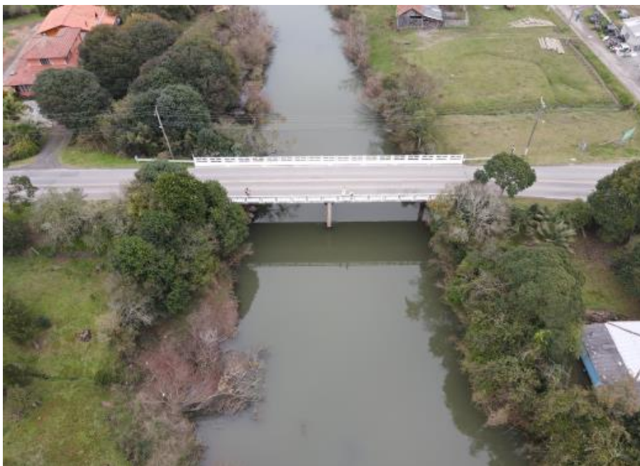
Figura 3 - Vista aérea da ponte.