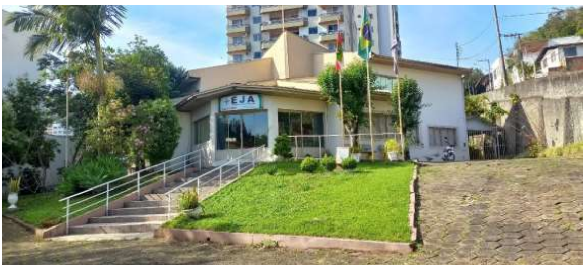
Foto 02 - Vista do EJA – UD Capinzal