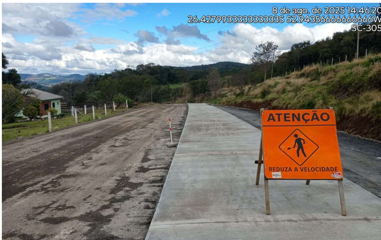
Fotografia 5 – Placa indicando a execução das obras.