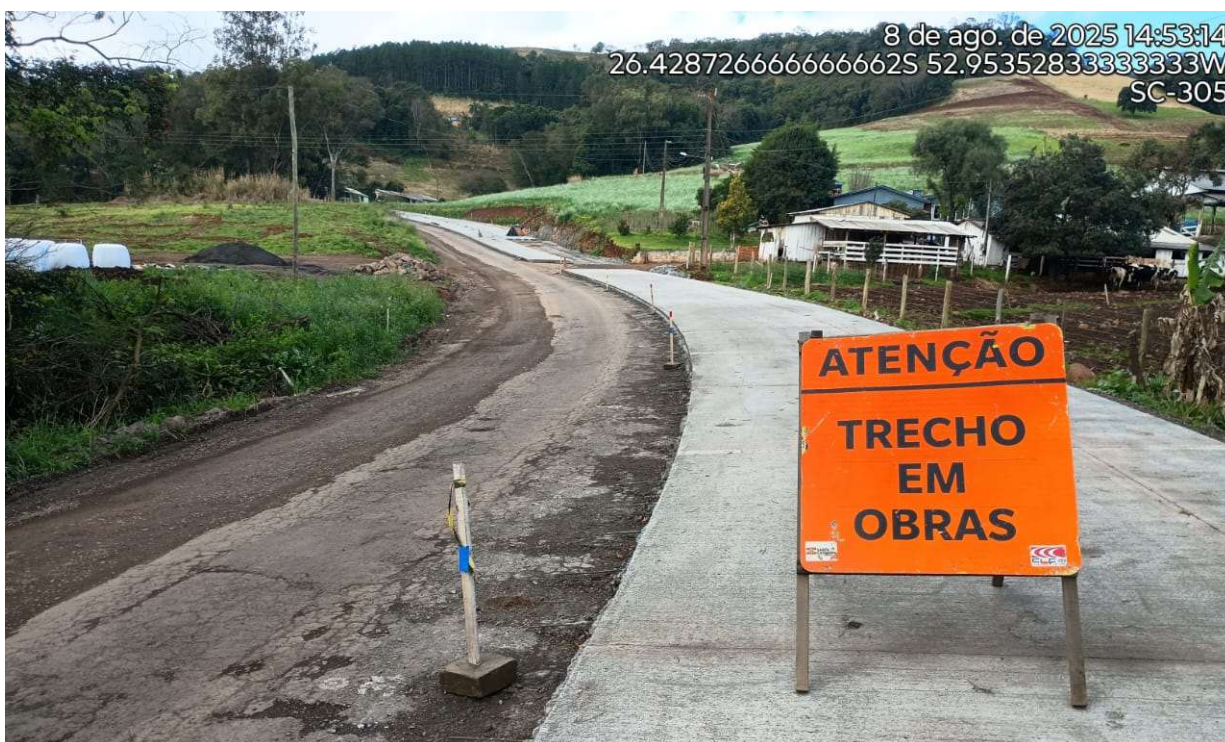
Fotografia 6 – Placa indicando a execução das obras.