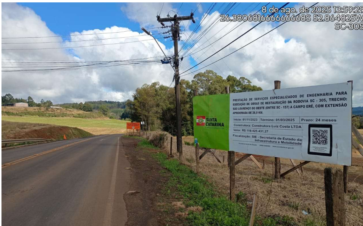
Fotografia 2 – Placa indicando a execução das obras.