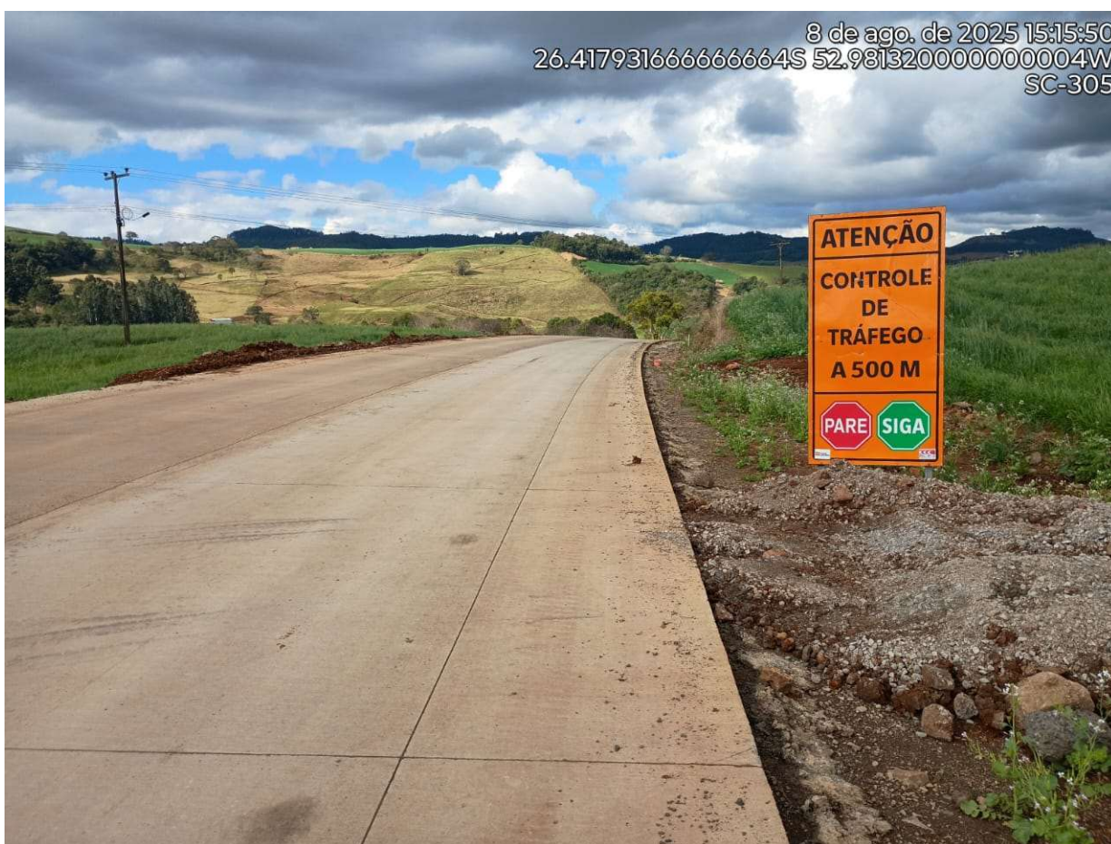
Fotografia 7 – Sistema Siga e Pare.

No entanto, reforçamos que essas intervenções são temporárias e fazem parte de um conjunto de ações necessárias para garantir melhorias significativas na infraestrutura da rodovia. O objetivo é proporcionar mais segurança, durabilidade e conforto a todos os motoristas e pedestres que trafegam por esse trecho.