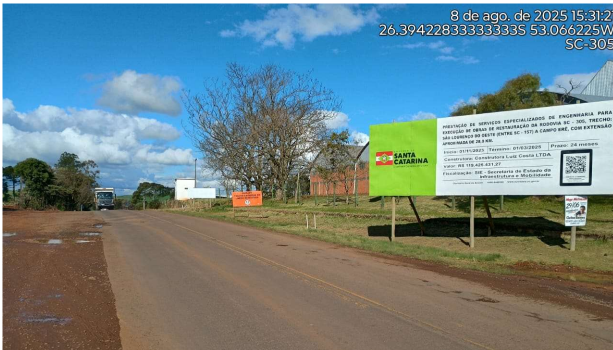
Fotografia 1 – Placa indicando a execução das obras.