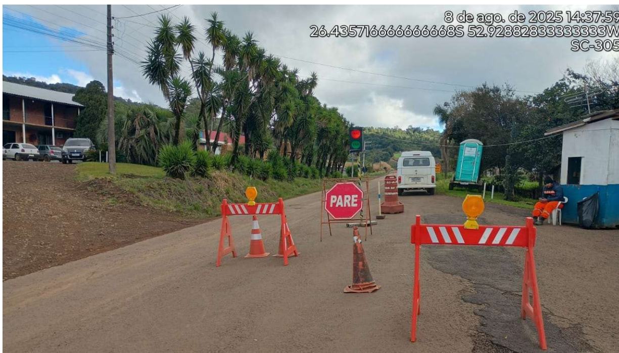
Fotografia 9 – Sistema Siga e Pare.