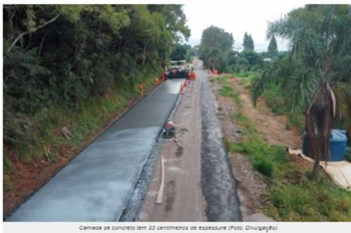
Cemeiro de concreto tem 23 centímetros de espessura

Os trabalhos de restauração – em concreto rígido – dos 28 quilômetros da SC-305 estão completando uma semana de execução. A obra acontece no trecho entre os municípios de São Lourenço do Oeste e Campo Erê, no Extremo-Oeste catarinense. O investimento da Secretaria da Infraestrutura e Mobilidade é de R$ 120 milhões.