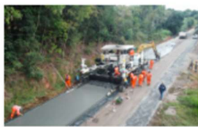
Pavimentação é feita na SC-305

A rodovia tem diariamente o tráfego de toneladas de grãos e proteína animal. Os dois municípios são grandes produtoras de feijão, milho, soja, trigo e arroz, além da pecuária bovina leiteira e corte e da produção de suínos e aves.