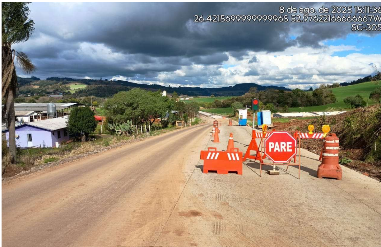
Fotografia 8 – Sistema Siga e Pare.