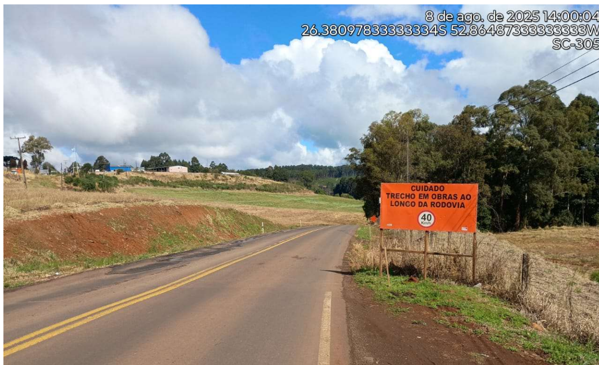
Fotografia 3 – Placa indicando a execução das obras.